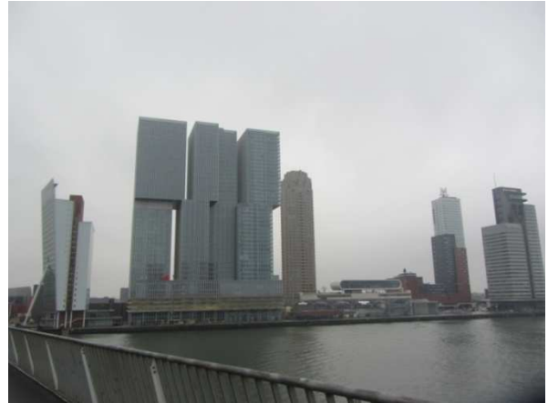
Il molo "Wilhelmina Pier" - "Piccola Manhattan"

Il porto di Rotterdam e' grandioso e toglie il fiato. La sua estensione e' di ca. 120 Km 2 , con una lunghezza di circa 40 km dal centro di Rotterdam, lungo le banchine del fiume Nieuwe Maas, fino alla foce. E' il piu' grande d'Europa e il terzo del mondo dopo Singapore e Shangai ed e' in continua espansione. E' un porto polivalente ed e' ritenuto il piu' grande del mondo per la quantita' di merci scambiate sia con navi oceaniche che con navi fluviali all'interno dell'Europa. E' il miglior porto Europeo per la dotazione di magazzini (logistica), di terminal per la movimentazione dei containers completamente automatizzato e di depositi di carburante.