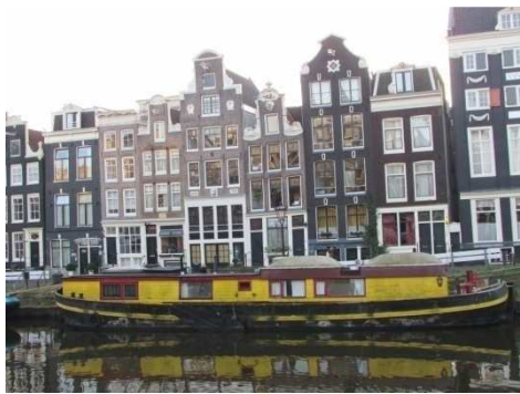
Casa sul canale Herengracht

scale interne molto anguste; per questo motivo i frontoni furono dotati di mensole per applicare le carrucole.