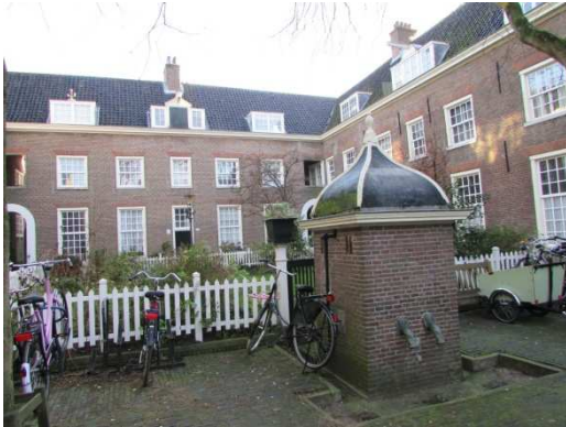
“Karthuizerhofje” su via Boomstraat

per le viuzze che paiono costruite alla rinfusa e per i famosi cortili verdi (hofjes), ancora oggi un tesoro dello Jordan, il cui accesso avveniva attraverso quasi 1000 corridoi che conducevano sul retro di quasi il doppio numero di case.