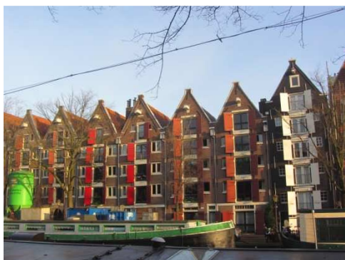
Case sul canale Brouwersgracht (dei "birrai")

Il canale del Principe è il vero canale delle case galleggianti (houseboats-modus vivendi più originale del mondo), oggi ad Amsterdam vi sono ca. 2500, un tempo battelli per il trasporto delle merci, oggi una vera e propria abitazione dotata di ogni confort e che è possibile anche affittare per un breve soggiorno in città.