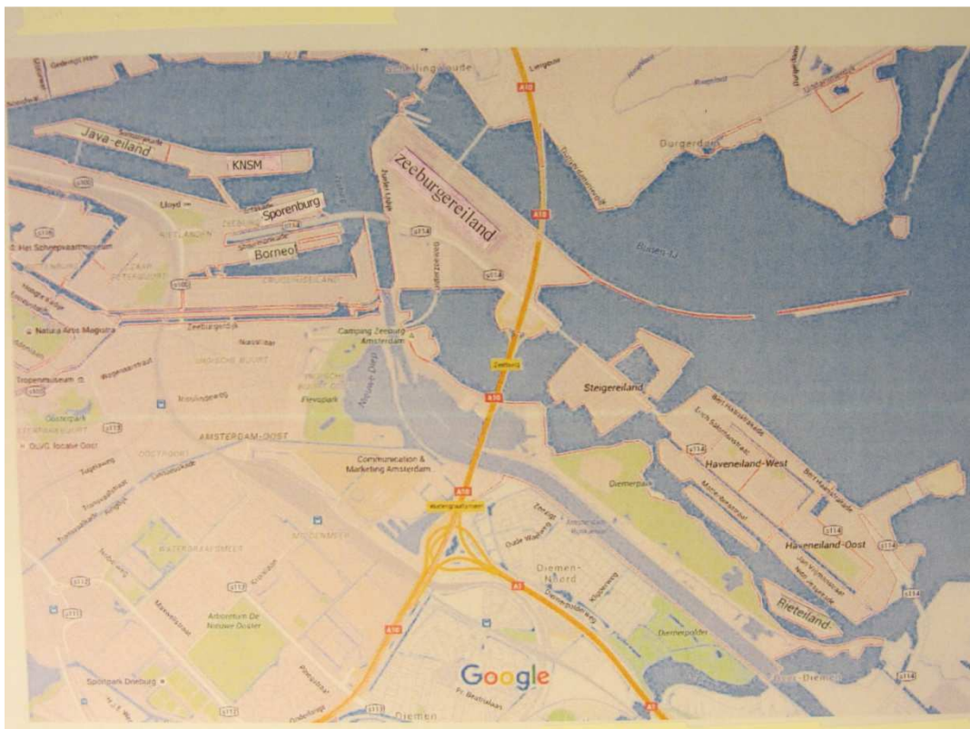
Mappa delle isole di "espansione urbanistica residenziale" visitate e poste ad Est del Centro di Amsterdam

poco distante, un'immensa folla raccolta intorno ad un enorme falò ci danno il loro arrivederci: Il nostro volo di ritorno ci aspetta e in serata ci imbarchiamo per fare ritorno alle destinazioni di provenienza.