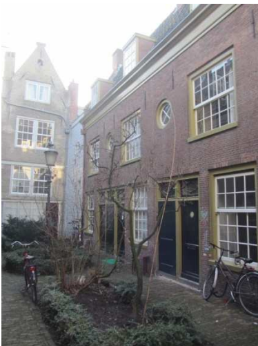
“Claeszhofje” tra le Tuinstraat e Egelantiersstraat

Ben presto, a seguito della crescita significativa della popolazione, le condizioni igienico/sanitarie dei residenti peggiorarono a tal punto che nel 1960 arrivò una legge per la conservazione dei monumenti che salvò l'intera area. Gli edifici quindi vennero ristrutturati, i canali più sporchi vennero coperti ed utilizzati come nuove strade e i famosi cortili verdi vennero preservati. Singolari sono le targhe ancor oggi visibili su molti edifici lungo i canali dove si possono ammirare bellissimi esempi di formelle murarie che servivano ad identificare l'origine, la religione e la professione degli abitanti della casa (vinai, falegnami, tabaccaia, mugnai, mercanti ecc.).