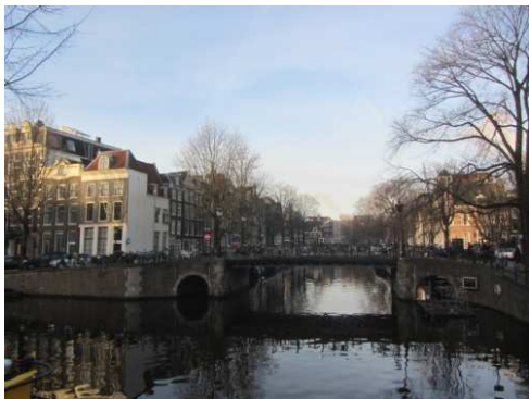
I canali Herengracht e Brouwersgracht

Superiamo i vari canali di cui, dei tre principali, impariamo i nomi (dall'interno verso l'esterno) Herengracht o "canale dei Patrizi o del Signore", il Keizersgracht o "canale dell'Imperatore", e il Prinsengracht o "canale del Principe", scavati nel XVII sec. in modo concentrico, su uno sviluppo a mezzaluna, intorno alla città, la cui area è stata inserita nella lista dei Patrimoni dell'Umanità dall'UNESCO dal 2010).