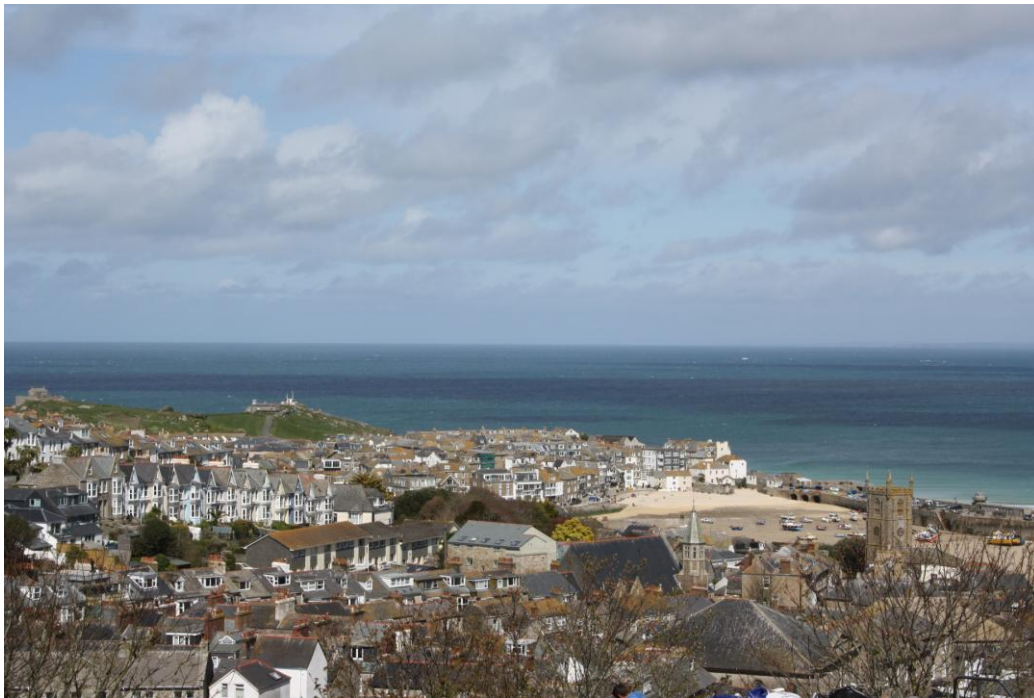
Vista di St. Ives

Meta di artisti, soprattutto pittori, ha una bella luce riflessa anche dalle basse case dai tetti d'ardesia, armonicamente dipinte in bianco, grigio e beige dorato come la sabbia della sua spiaggia.