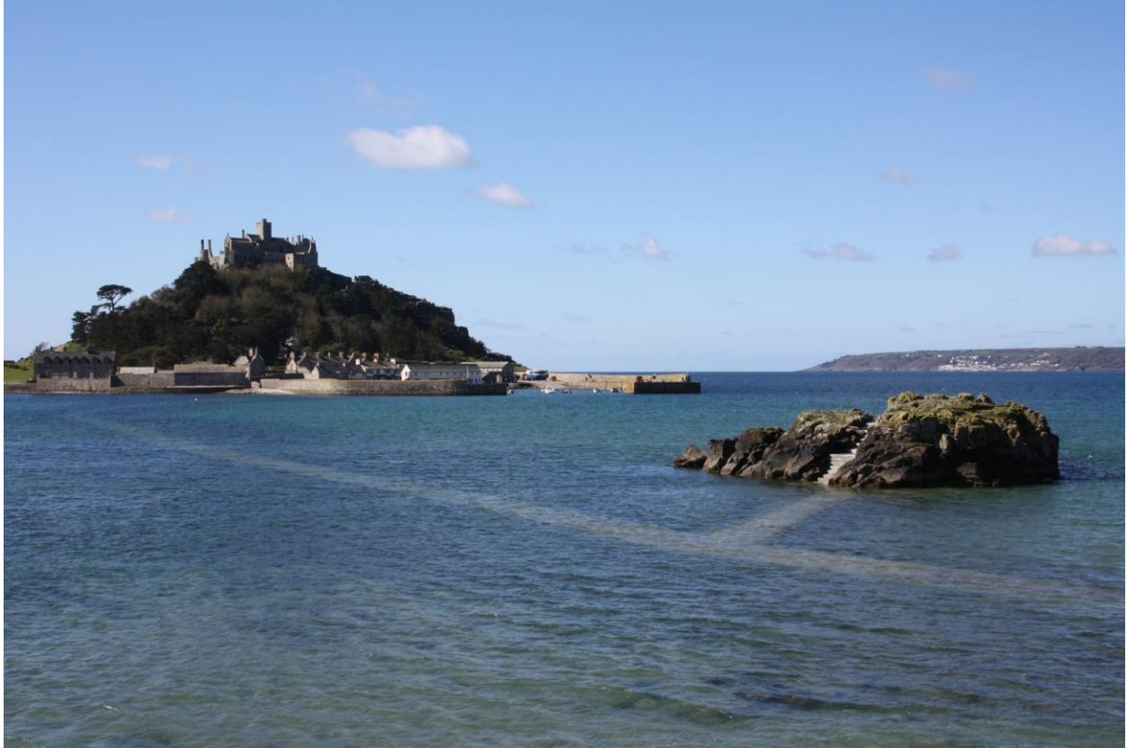
St. Michael's Mount

Durante la bassa marea c'è un sentiero percorribile a piedi di poco meno di un chilometro.