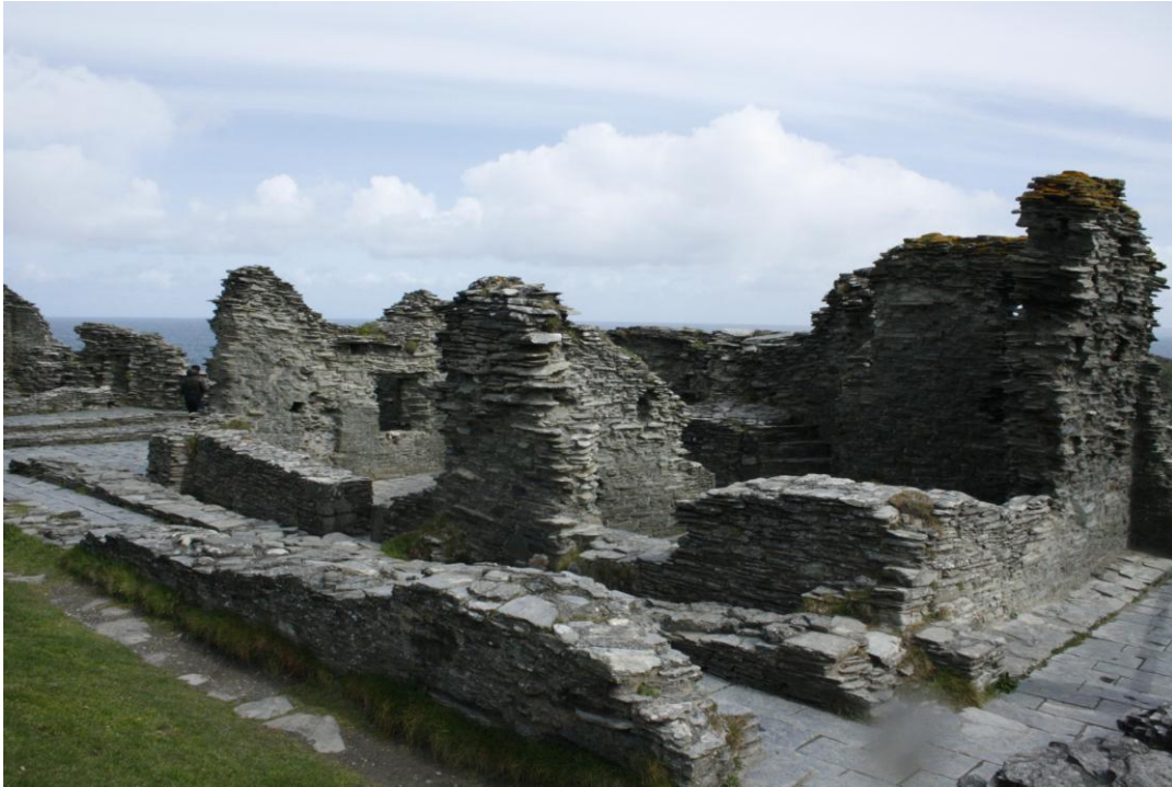
Rovine di Tintagel

La meta di oggi é Tintagel, un villaggio arroccato su uno sperone roccioso dove la leggenda individua il luogo di nascita del mitico re Artù. Ci avventuriamo tra le rovine del castello medioevale dove il panorama ripaga generosamente dei piccoli brividi della salita.