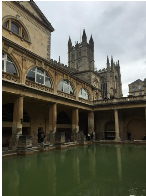
Terme di Bath

Le terme sono ancora utilizzate e valorizzate da un ricco museo che illustra al visitatore tutta la storia legata alle loro origini.