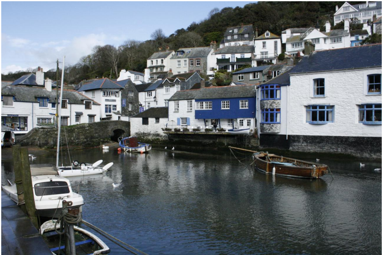
Porticciolo di Polperro

Con cielo e sole tersi lasciamo Plymouth alla volta di Polperro. Finalmente, dopo aver superato il confine naturale tracciato dal fiume Tamar, entriamo in Cornovaglia! Durante il trasferimento incappiamo in una pioggia improvvisa ma fortunatamente di breve durata e nella rapida visione di una spolverata di neve del giorno precedente! Polperro però ci accoglie con il sole, accompagnato dal solito vento, ma a questo oramai ci stiamo abituando!