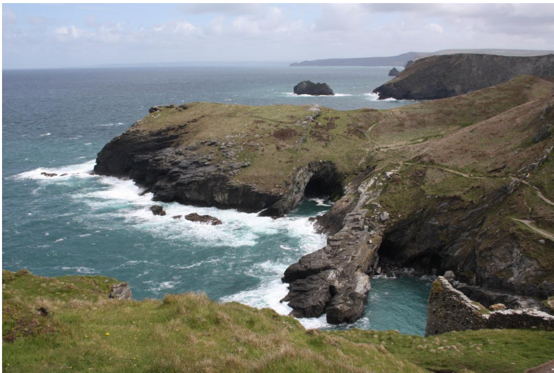
Scogliere di Tintagel