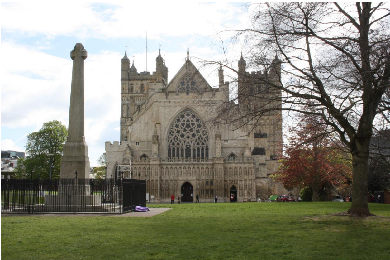
Cattedrale di Exeter

Ci attende Exeter con la sua possente cattedrale in stile gotico ornato, dal bel rosone, l'orologio astronomico del XV secolo e le vetrate absidali.