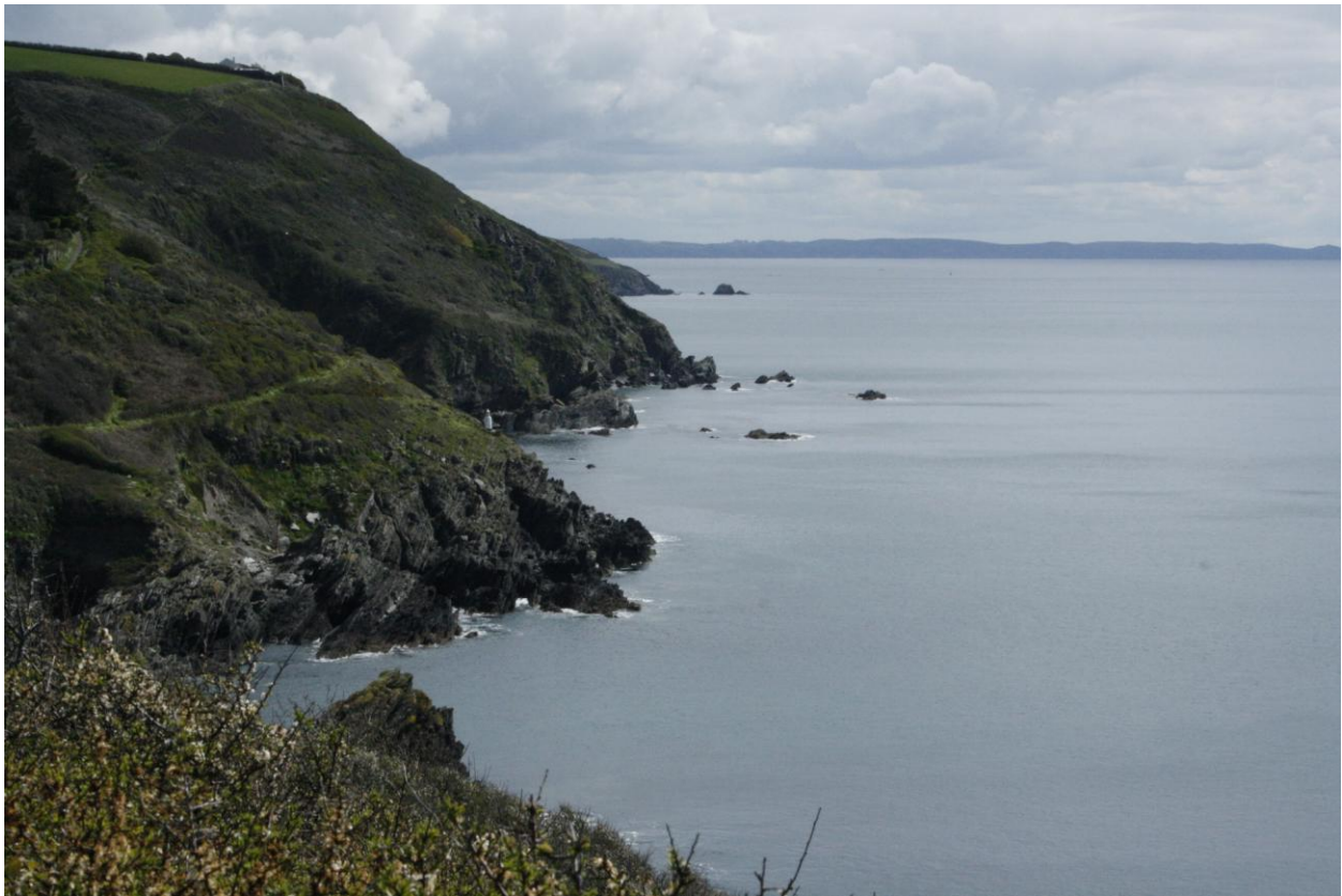
Il sentiero di Polperro

Sulla via del ritorno al bus scorpacciate di pastry e fudge, le specialità gastronomiche della regione.