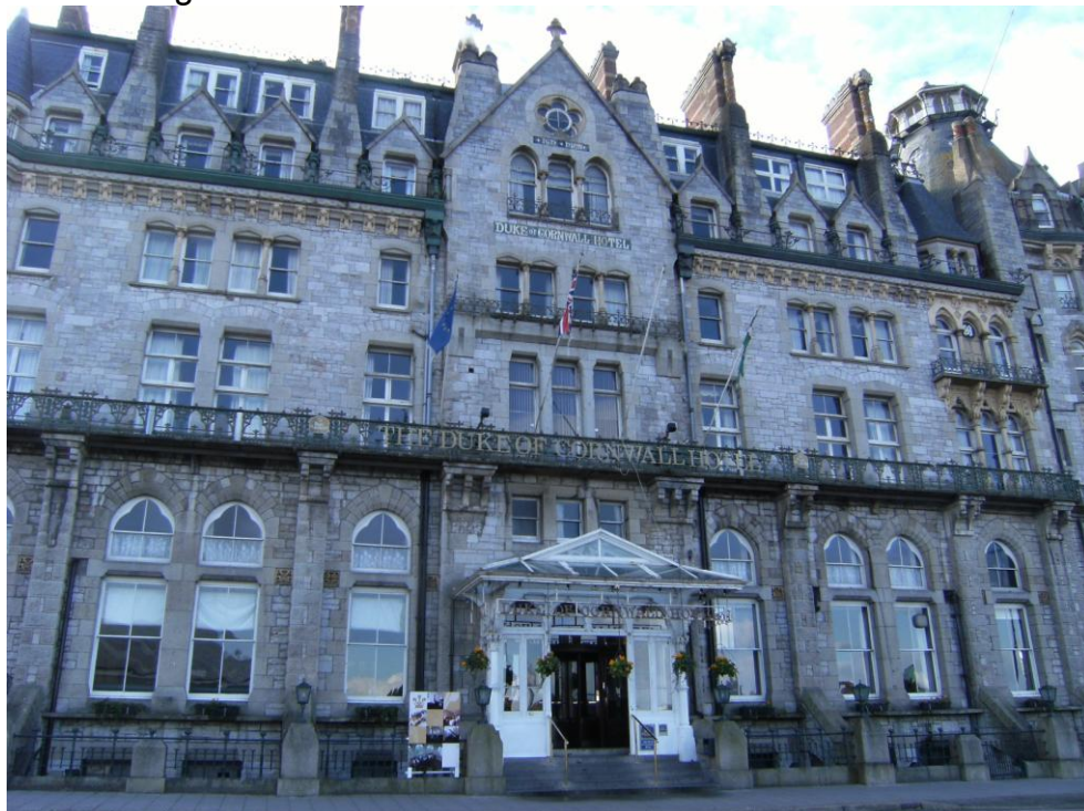
Hotel Duke of Cornwall

L'hotel "The Duke of Cornwall" rievoca nell'architettura e negli ambienti il gusto ed il fasto dell' "ancien regime"!