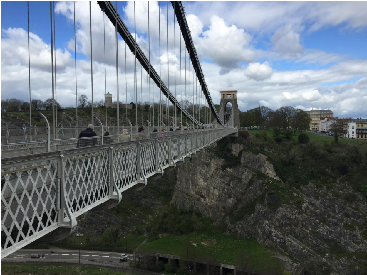
Ponte sospeso di Clifton

Prima ancora di arrivare a Bristol, città dove pernosteremo, sostiamo ad ammirare il ponte sospeso di Clifton sul fiume Avon, opera prima dell'ingegner Brunel della metà del 1800 e la chiesa gotica di St. Mary Redcliffe dalle belle vetrate colorate.