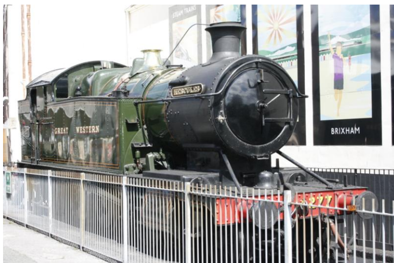
Locomotiva a vapore

A Paignton, prossima a Torquay, saliamo su un treno a vapore che in mezz'ora ci porta a Dartmouth dove sbarchiamo dopo un breve traghetto su una piccola imbarcazione. Entrambi, deliziosi villaggi distesi sulle morbide colline del Devon.