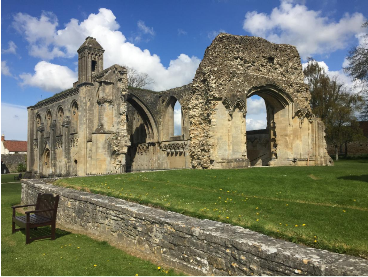
Rovine di Glastonbury Abbey