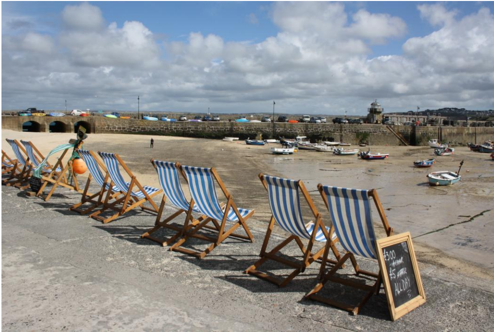
Barche in secca

Completiamo la giornata con una visita a St. Ives, grosso centro turistico con un porticciolo dove la marea in ritirata ha lasciato in secca le barche ancorate.