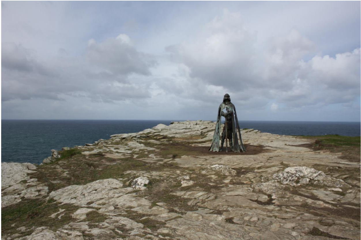
Il leggendario re Artù

Nel pomeriggio eccoci a Lanhydrock in visita ad una abitazione di campagna affidata alle cure del National Trust, completa di tutto ciò che poteva servire ad una famiglia nobile nel XIX-XX secolo.