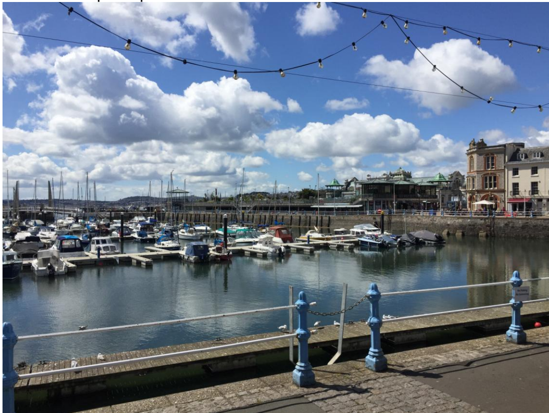
Baia di Torquay

Ultimata la visita abbiamo tempo per immergerci nella vita quotidiana della cittadina che possiede un grazioso centro storico con numerose case a graticcio; dopodiché si riparte con meta Torquay attraversando la verde e ondulata campagna del Devon. Città turistica, capitale della “English riviera” affacciata sul canale della Manica, dal clima mite che permette la crescita di palme e fiori esotici. Qui nacque Agatha Christie che vi ambientò anche alcuni dei suoi libri. Lungomare signorile dove, sparpagliati, consumiamo un rapido spuntino.