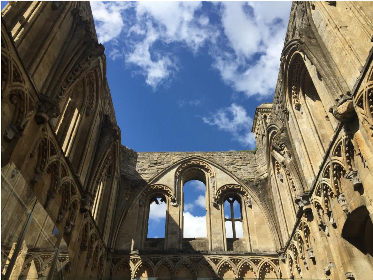
Rovine di Glastonbury Abbey