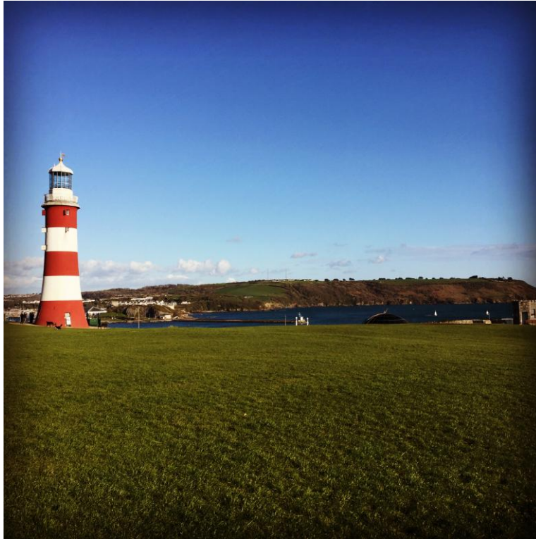
Faro di Plymouth

Sul promontorio che domina il porto e la città intera si trovano una possente cittadella ed un ampio parco pubblico su cui svetta la sagoma bianca e rossa di un faro spostato qui da una scoglio marino.