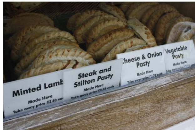
Fudge e Pasty per tutti!

Per la pausa pranzo sostiamo a Fowey e ci sparpagliamo nei vari localini, generalmente accoglienti.