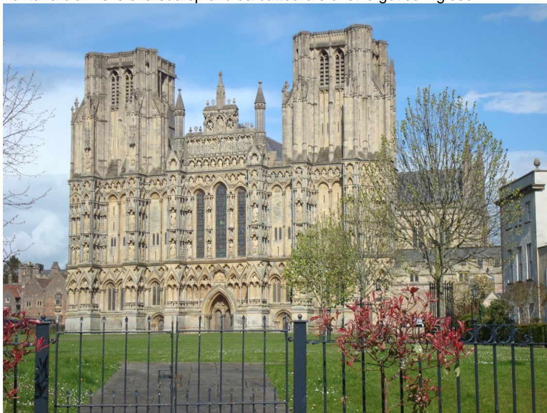
Cattedrale di Wells

In effetti circolano personaggi stravaganti per abbigliamento e atteggiamenti, numerosi i piccoli negozi, nel complesso un'atmosfera un pò bohémienne già figli dei fiori! Non lontana c'è Wells e la sua splendida cattedrale di stile gotico inglese.