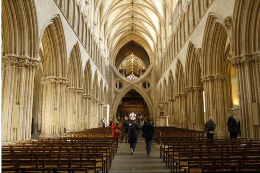
Archi a forbice

Notevoli gli archi a forbice del suo interno e gli stalli dei canonici.