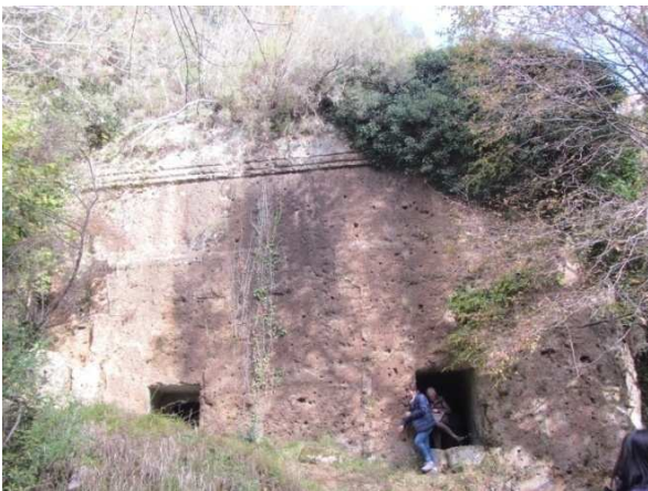
di grandi dimensioni, quasi totalmente avvolta dalla vegetazione, con due ingressi uguali che davano accesso a due camere sepolcrali identiche e con quattro "letti funerari" ciascuna. Il frontone conserva ancora l'originaria decorazione. Poco lontano la "Tomba del Cervo" (eta' ellenistica IV° sec. A.C.),