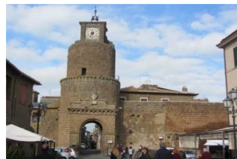
Visitiamo poi la cittadina di BARBARANO ROMANO , un monumento vivente dato dalla sovrapposizione dei periodi culturali umani. Questo singolare abitato, situato sopra una rupe tufacea, risalente al "Bronzo Antico" (XVIII-XVI sec. A.C.), ancora oggi cinto dalle sue fortificazioni realizzate in fasi successive ( dal XIII al XV sec.), con torri quadrate (le piu' antiche) e torri rotonde (piu' recenti), si erge al centro di un'area naturale protetta e proprio per questo e' un museo all'aperto, naturalistico, archeologico, nonche' delle attivita' tradizionali locali. Entriamo sotto il torrione di "Porta Romana" con orologio del 1763 (la porta originaria era a destra per motivi di sicurezza bellica)