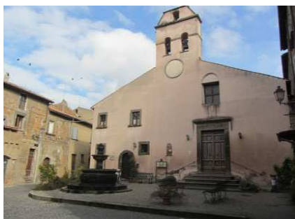
Piazza Cavour con la chiesa di S. Angelo

e percorriamo la via Vittorio Emanuele II°, costeggiata da edifici nobiliari ed ex porticati (sede di antiche botteghe), piu' avanti Piazza Cavour con la Chiesa di S. Angelo (XIII sec.), il Largo di Porta Console ( da cui si sviluppa un percorso lastricato a gradoni in discesa che, attraverso una porta, dava accesso direttamente ai campi sottostanti), il Palazzo Comunale con retrostante la Chiesa dell'Assunta, il Piazzale Belvedere da cui si puo' ammirare il vallone del torrente "Pisciarello" e l'altura di "Campecora", sede di un antico villaggio dell'eta' del Bronzo.