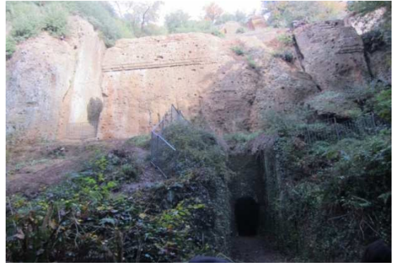
probabilmente una tomba di famiglia, grande semidado scolpito nel tufo a cui si accede attraverso un corridoio delimitato da due pareti tufacee. La camera funeraria e' molto ampia ma senza "letti funerari", testimonianza dell'evoluzione della sepoltura alla fine del V° sec., dentro sarcofagi. Lateralmente una scala da' accesso ad una terrazza superiore da cui si puo' ammirare un bassorilievo, presumibilmente raffigurante un cervo contrapposto ad un lupo, attualmente simbolo del "Parco del Marturanum".