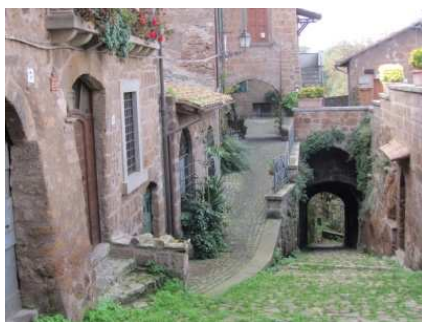
Largo di Porta Console

Al ritorno ammiriamo le scalinate esterne (Profferli) di accesso alle abitazioni sopra il piano stradale, tipiche dell'architettura Tardo-Medioevale Viterbese.