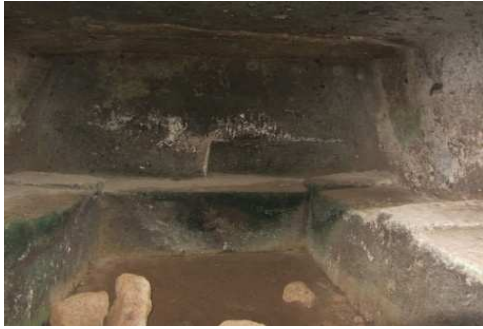
Piu' avanti vediamo le "Tombe a Portico" (VI°-V° sec. A.C. ),