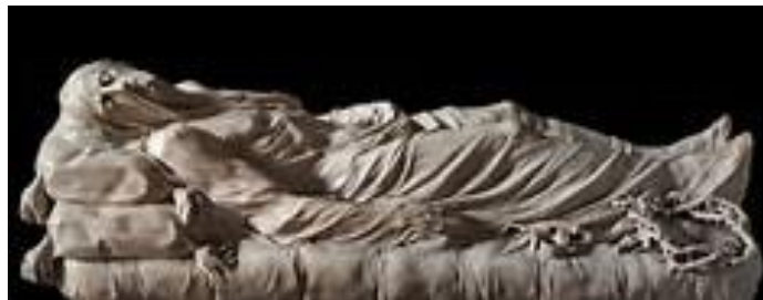
Giuseppe Sanmartino, Cristo velato .

È come avesse guidato le mani virtuose degli scultori che realizzarono le statue, donando loro una forza espressiva e simbolica che unifica e sintetizza la sua fede massonica, le dolorose vicende familiari e i suoi ideali filosofici e scientifici.