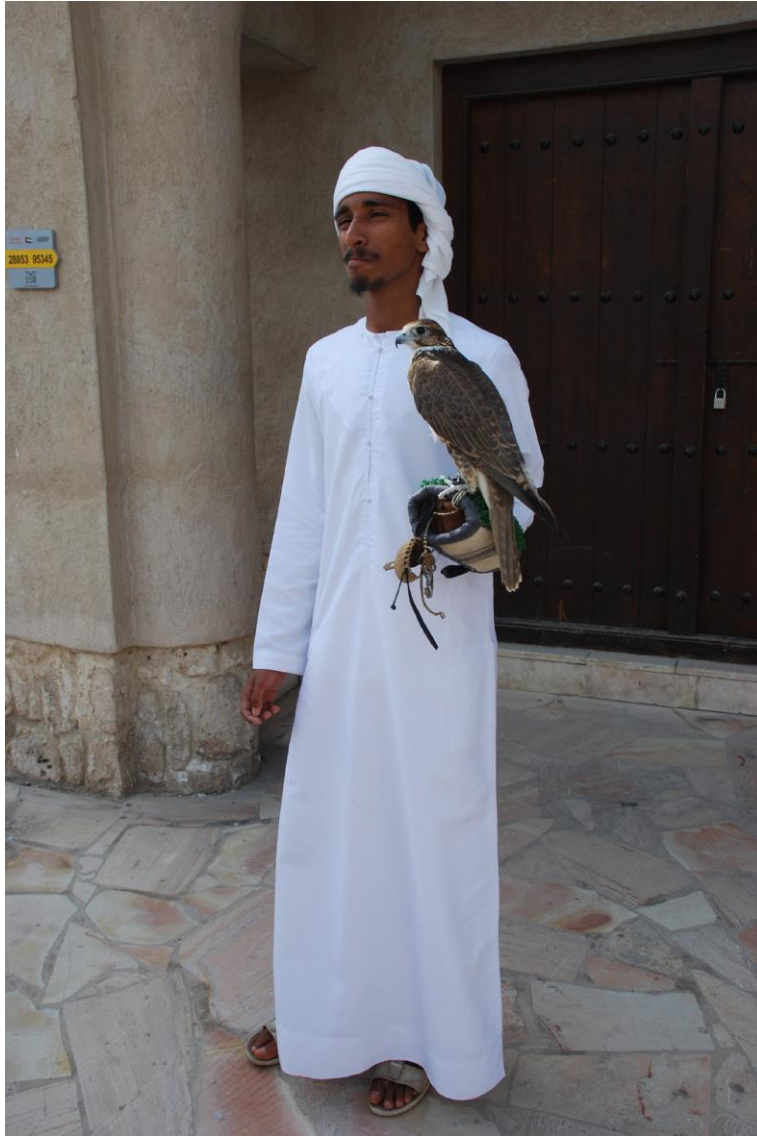
Figura 3: Falconiere nel quartiere di Al Fahidi, noto anche col nome persiano di Al Bastakiya.

due ore attuali. Poi ognuno si disperde in un mare magnum di stimoli visivi e sensoriali entrando e uscendo da mondi ricchi di suggestioni. Le strade dell'Expo pullulano di persone di tutte le nazionalità, di robot, di sfilate di carri allegorici e di figure mascherate in un affascinante e colorato crogiuolo. Stremati e soddisfatti della sarabanda di stimoli ed emozioni da cui siamo stati sollecitati per tutto il giorno, ci ritiriamo in albergo verso sera.