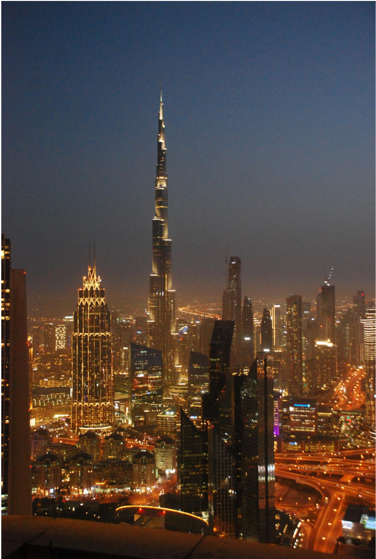
Figura 11: Il Burj Khalifa e l'area circostante dal caffè al 78° piano del Gevora Hotel.