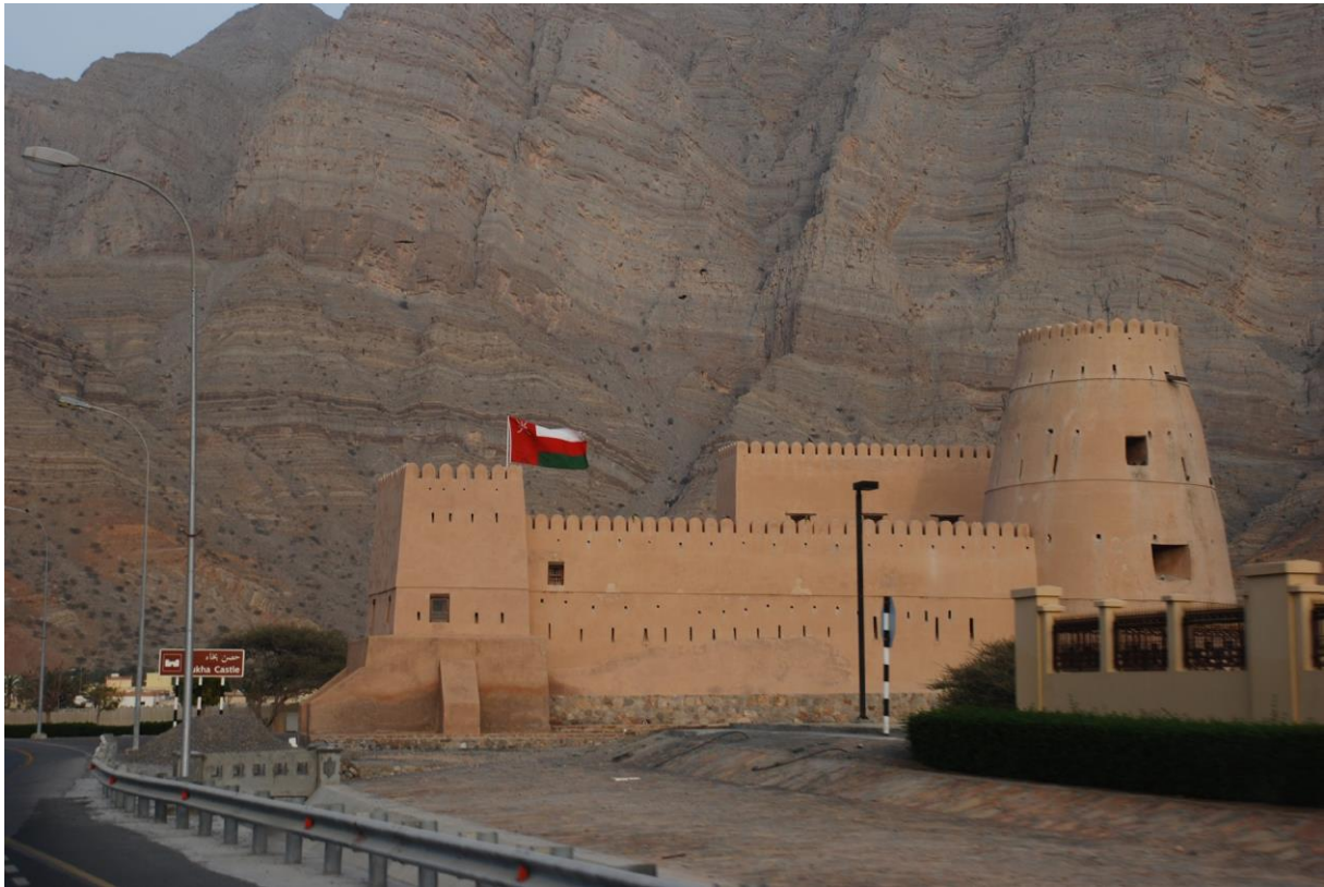
Figura 14: Il castello di Bukha nel Musandam, Oman.