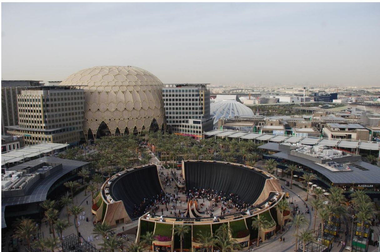
Figura 2: Expo 2020, Fontana e Padiglione centrale.