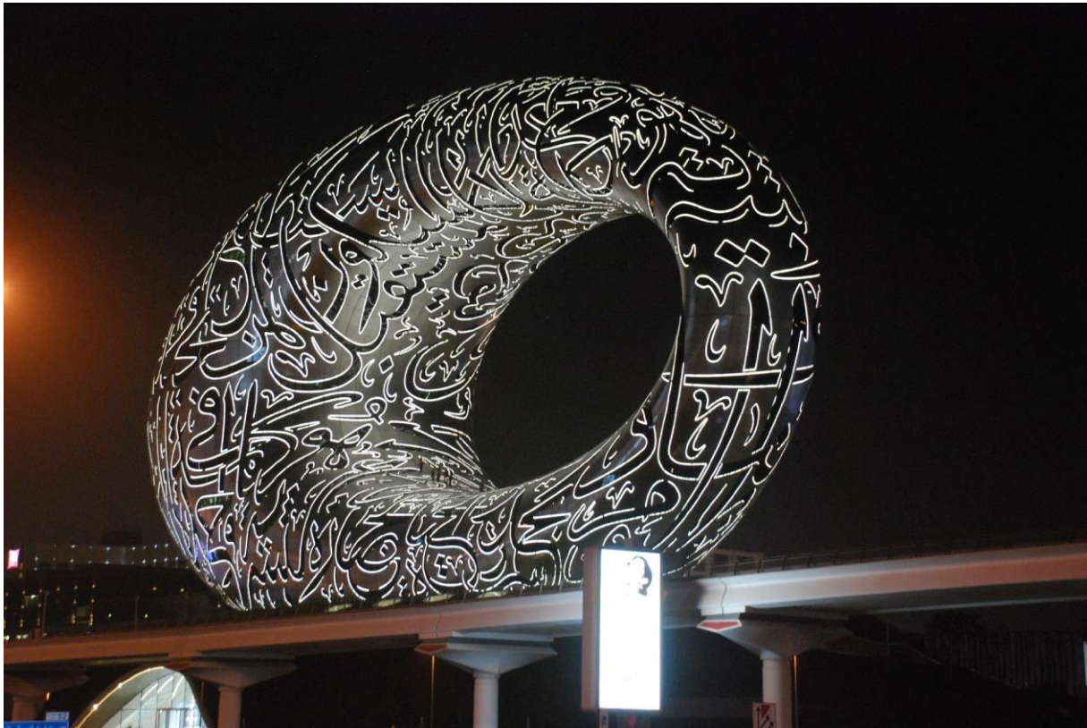
Figura 12: L'edificio simbolo del Museo del Futuro in notturna, sviluppato dalla Dubai Future Foundation e firmato dal team di architetti di Shaun Killa in collaborazione con la società di consulenza ingegneristica Buro Happold.

(Pala Jebel Ali) iniziata nel 2002 (penisola artificiale) che va un po' a rilento a causa della stretta creditizia che stringe Dubai. Quando sarà ultimata, sarà possibile leggere dall'alto nel suo disegno i versi con cui si apre questo resoconto di viaggio che appartengono allo sceicco sovrano di Dubai, Mohammed Raschid Al Maktoum. Se la prima palma ospita un quartiere di 150.000 persone, questa sarà in grado di ospitarne 250.000.