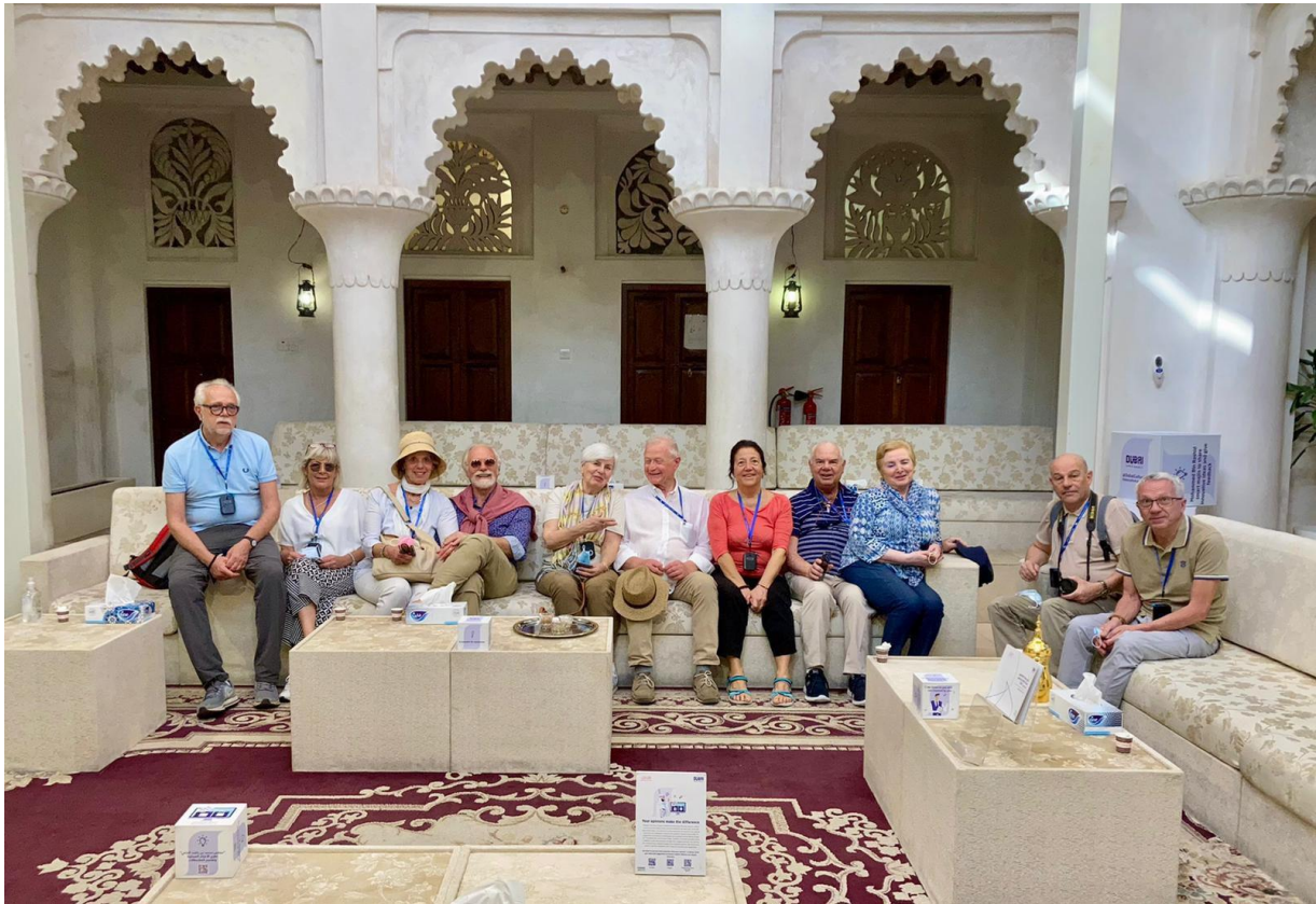
Figura 4: Il nostro gruppo in un Dar adibito a museo del quartiere di Al Fahidi o Al Bastakiya.