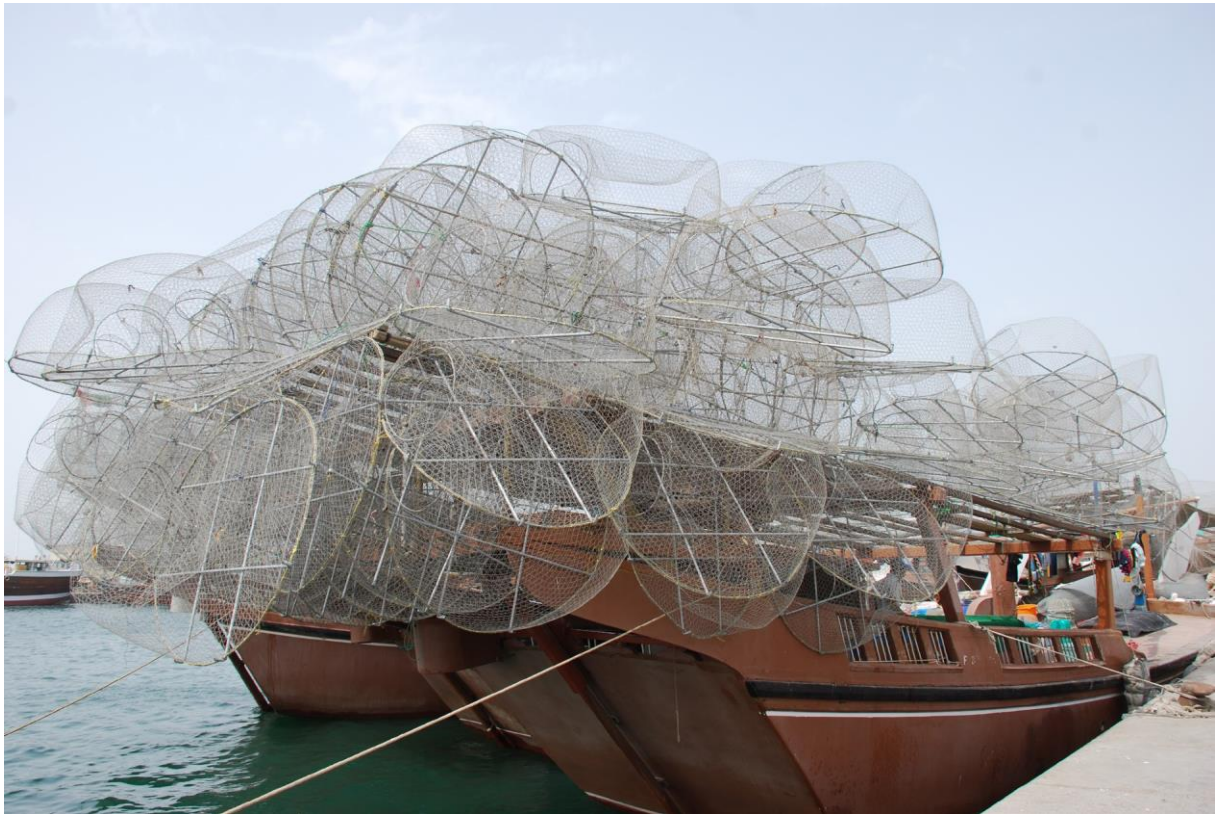
Figura 13: Barche di pescatori a Sharjah, presso il mercato del pesce. (Foto: P. Pedrocco).