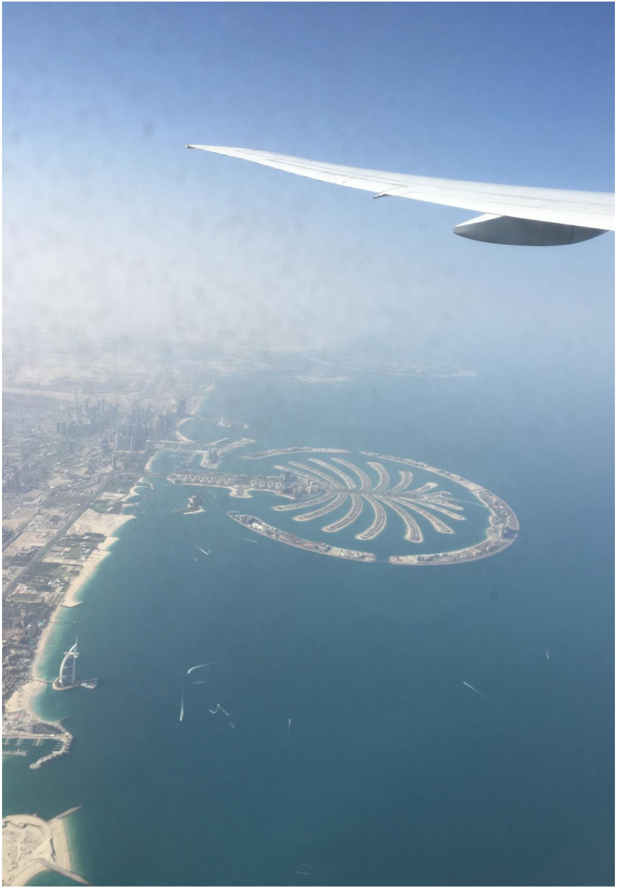
Figura 19: Lasciando Dubai. (Foto: P. Pedrocco).