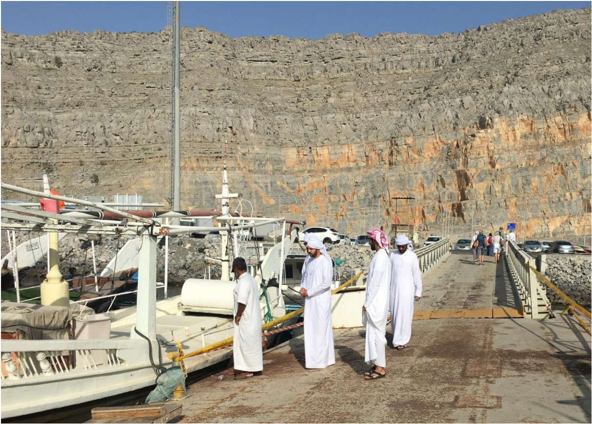
Figura 18: Trattative al Porto di Khasab, Musandam, Oman.