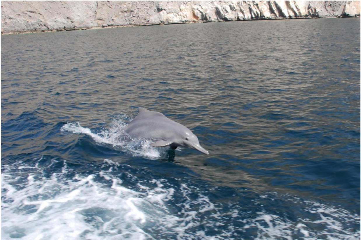
Figura 15: Delfino dall'occhietto furbino, andando verso la Telegraph Island o Jazirat Saghir, nel Musandam, Oman.