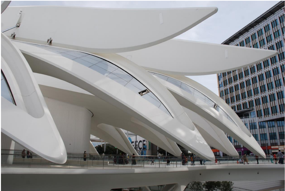
Figura 1: Expo 2020, Padiglione degli Emirati Arabi Uniti. (Foto: P. Pedrocco).