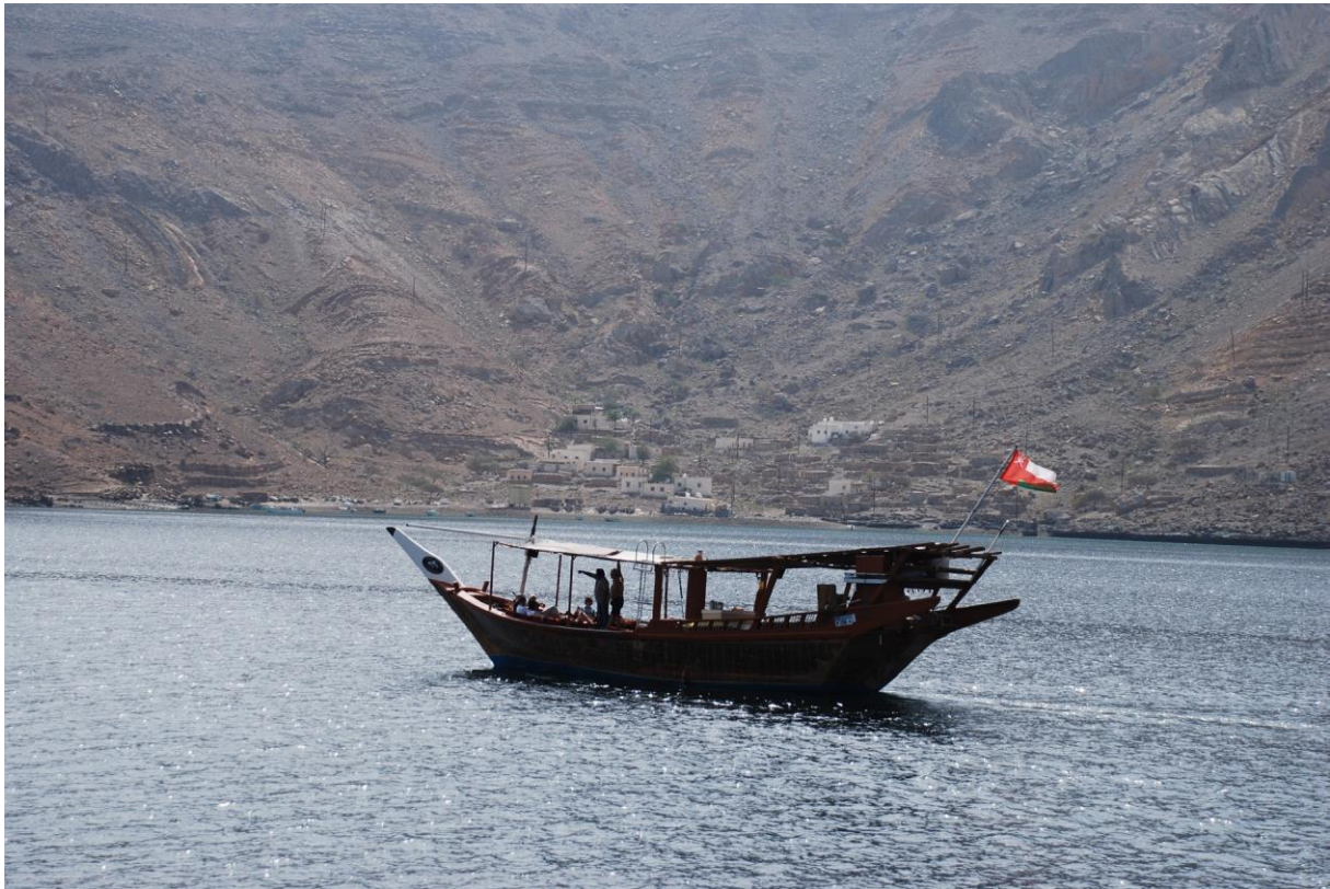
Figura 16: Imbarcazione caratteristica, dhow , e villaggio di pescatori raggiungibile solo via mare nel Fiordo del Musandam presso Khasab, Oman.

penisola del Musandam, separata tramite il territorio degli Emirati Arabi Uniti rispetto allo stesso Oman, dove ci attende tutto un altro mondo: un paesaggio lunare, arido, montagnoso e solitario si affaccia a precipizio sul mare. Attraversiamo un piccolo villaggio dove dei ragazzi giocano a calcio in un campo polveroso circondato da casette che s'inerpicano sulla montagna; l'atmosfera è ricca di fascino e di mistero. Giungiamo in un albergo molto bello affacciato su un'insenatura marina e la sera andiamo a mangiare a Kashab, dove abbiamo modo di ammirare la fortezza costruita dai Portoghesi che ottennero il controllo della regione e dello stretto di Hormuz all'inizio del XVII secolo. Andiamo a dormire: l'indomani ci attende un'emozionante navigazione a bordo di un dhow .