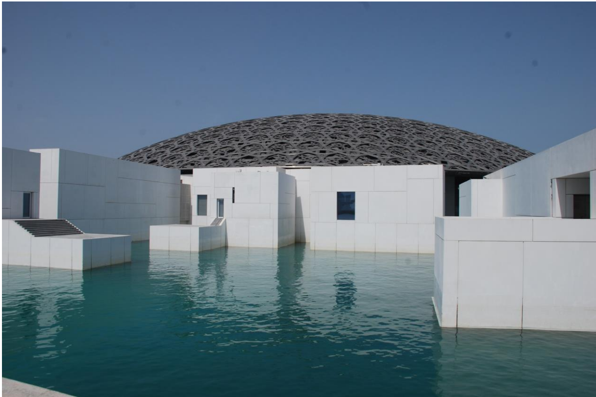
Figura 7: Esterno con darsena e cupola del Museo del Louvre di Abu Dhabi, opera dell'architetto Jean Nouvel. (Foto: P. Pedrocco).