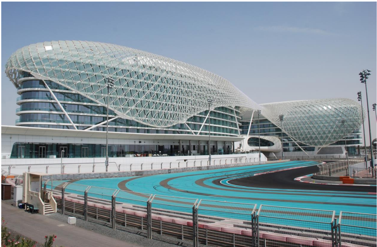
Figura 8: Garage Restaurant, dove ceneremo, al Yas Viceroy Abu Dhabi Hotel, presso lo Yas Marina Circuit, Yas Island - Abu Dhabi.