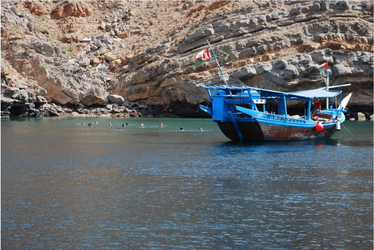
Figura 17: Balneazione nel Fiordo del Musandam presso Khasab, Oman.