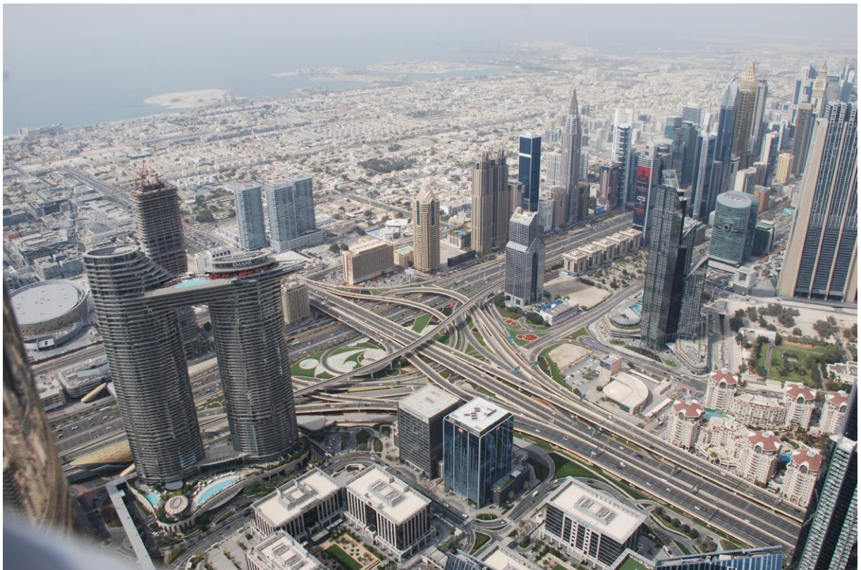
Figura 5: Vista dell'incrocio tra la Amer Sheikh Zayed Road, che attraversa longitudinalmente la città di Dubai, con la Al Safa Street dal 125 piano del Burj Khalifa.