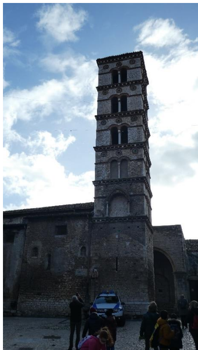
Sermoneta: Campanile della cattedrale

Vi soggiornarono, nel tempo: Carlo V, Federico II, Papa Gregorio VII, Papa Sisto V e per un lungo periodo Lucrezia Borgia.