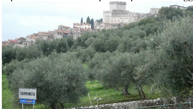
Sermoneta: la cittadina

Tornati in piazza del Popolo, ci siamo diretti alla "Loggia dei Mercanti", un edificio d'angolo situato all'altra estremità della piazza, il cui fianco laterale, oltre la curva della strada carrabile, ospita la breve scala che porta al piano della loggia.