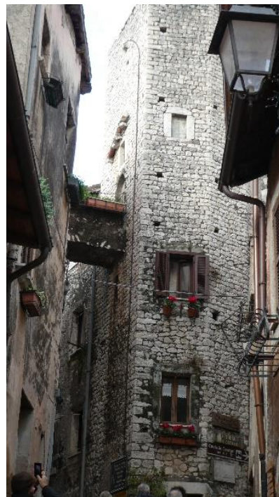
Sermoneta: ponticello tra abitazioni