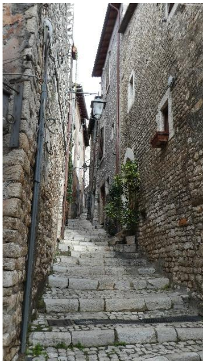
Sermoneta: Vicolo a gradini