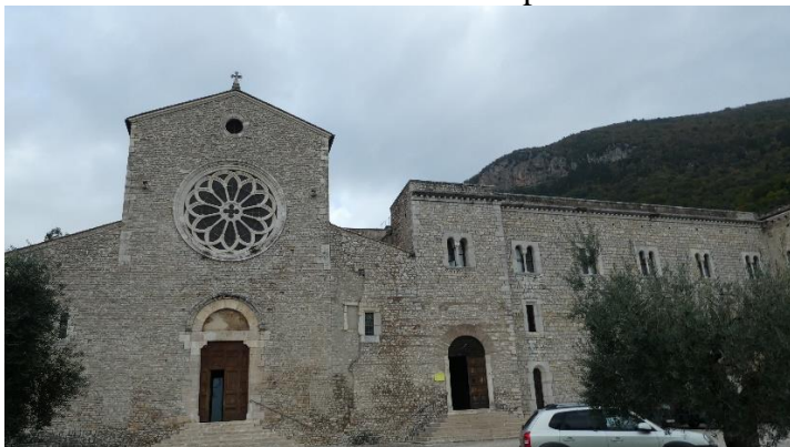
Valvisciolo: Chiesa e convento

Rompe la regola la cappella di San Lorenzo, sul fondo della navata sinistra, che fu affrescata nel 1586-89, dal pittore Nicolò Circognani, in occasione di una visita papale all'abbazia. L'affresco venne eseguito su commissione del Cardinale Enrico Caetani – un nome che ritroveremo a Sermoneta - e del Duca Onorato IV. Alla destra della chiesa si trova il chiostro, come di consueto nei complessi abbaziali; esso è contornato da colonnine binate e l'area scoperta è tenuta a giardino, al cui centro è collocata una vera da pozzo.