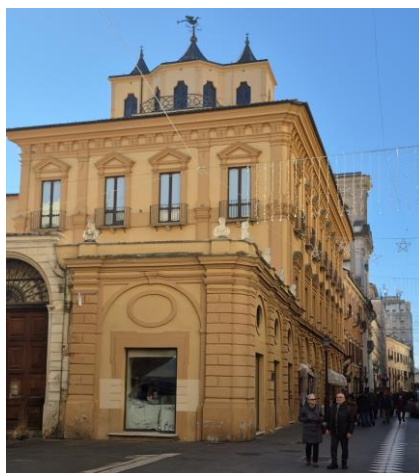
Palazzo De Mayo