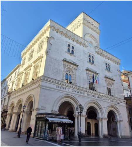
Palazzo delle Corporazioni