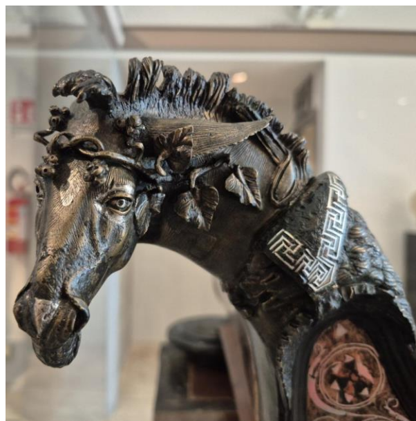
Terminazione della spalliera del letto funerario