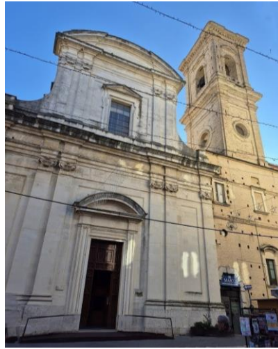
Chiesa di San Domenico