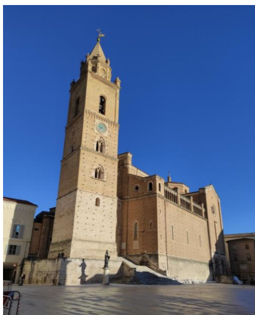
La cattedrale di San Giustino

L'interno si presenta con una larga navata centrale, un tempo con tetto a capanna ma ora con volta a botte, e due strette navate laterali. La pala dell'altare è dedicata a San Tommaso perché le reliquie dell'apostolo prima di giungere a Ortona transitarono per Chieti. La tela del Santo, per la tradizione di Napoli trasportata dai numerosi vescovi napoletani, a Natale scompare a favore di una della Natività. Il capolavoro del presbiterio è il barocco paliotto di Sammartino (lo scultore del Cristo velato di Napoli) che illustra meravigliosamente la storia (o leggenda) della chiamata di San Giustino. La cripta è in stile prevalente romanico con una serie di campate irregolari, coperte da volte in mattoni a crociera, rette perlopiù da archi a tutto sesto poggianti su capitelli e pilastri di recupero da costruzioni precedenti, si presume, anche di un tempio romano dedicato a Giove o, ancor prima, di un tempio italico dedicato ad Ercole. La cripta era destinata a sepolture e inizialmente scevra d'ornamenti, ma in periodo barocco fu decorata con fastosi stucchi e pitture. Da alcuni anni la cripta è stata riportata alla semplicità originaria eliminando tutti i barocchismi e svelando antichi affreschi: una Resurrezione e un ritratto di San Giustino del XIV secolo e una Crocifissione e un Compianto sul Cristo Morto del XV secolo. Un'urna in marmo contiene le reliquie, molto venerate dai teatini, di San Giustino.