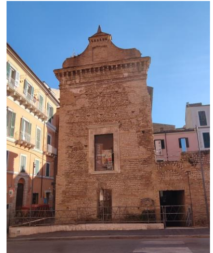
Tempio dei Dioscuri