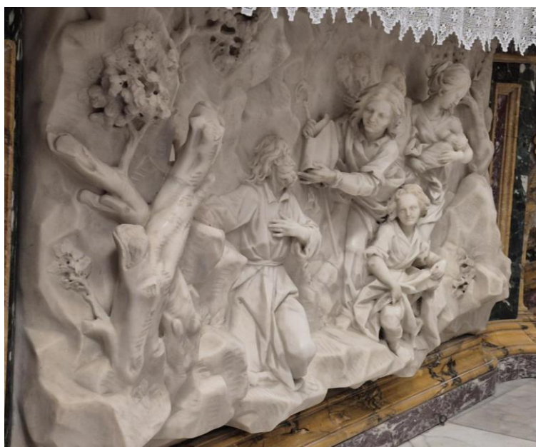
Il paliotto del Sammartino