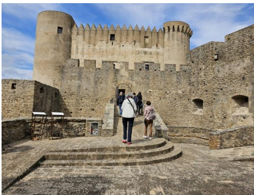
Il castello di Santa Severina

ma conobbe lunghi periodi di abbandono. Fra il 1994 e il 1998 è stato sottoposto ad un'attenta e meticolosa opera di restauro. Oggi ospita il Museo di Santa Severina , in cui sono esposti i reperti degli scavi e altri materiali e collezioni archeologiche provenienti dal territorio limitrofo. Il borgo di Santa Severina disposto attorno al castello costituisce un complesso monumentale omogeneo, che ospita al suo interno edifici di grande valore storico e architettonico. Su tutti, il Battistero bizantino , unico esempio di battistero bizantino esistente in Calabria, ancora integro: di forma circolare, a pianta cruciforme, con tamburo della cupola ottagonale e il cupolino cilindrico. La Cattedrale di Santa Anastasia , del XIII secolo, oggi in forma seicentesca. Si ridiscende con lo scuolabus per raggiungere il pullman diretti verso la costa tirrenica, attraversando la Sila.