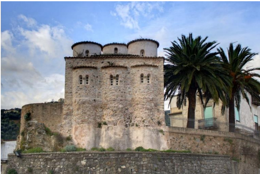
L'Oratorio di San Marco

ROSSANO. L'abitato di Rossano, arroccato sui primi contrafforti della Sila Greca fu meta di conquista da parte di numerosi invasori (Visigoti, Longobardi, Saraceni) ma non fu mai espugnato. La visita è dedicata, dapprima, ad alcuni monumenti religiosi: la Cattedrale di Maria Santissima Achirópita : eretta nell'XI secolo su una precedente costruzione bizantina, la cattedrale ha subito numerosi rimaneggiamenti; la facciata e il campanile sono stati ricostruiti dopo il terremoto del 1836. In una nicchia della navata centrale, è custodita l'icona della Madonna Achirópita ("non dipinta da mano umana"), venerata dal XII secolo; l' Oratorio di San Marco : molto interessante e particolare per la sua forma architettonica, sorge su uno sperone di roccia tufacea all'estremità del centro di Rossano. Si tratta di un edificio bizantino, uno dei massimi esempi presenti in Calabria. L'edificio, di forma quadrata con pianta a croce greca, è caratterizzato da cinque cupole cilindriche.