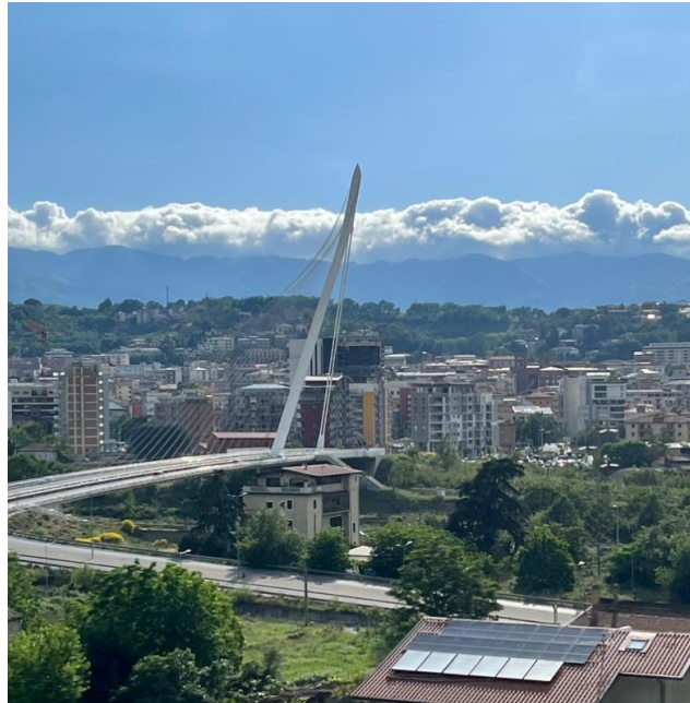
Cosenza. Il ponte di Calatrava