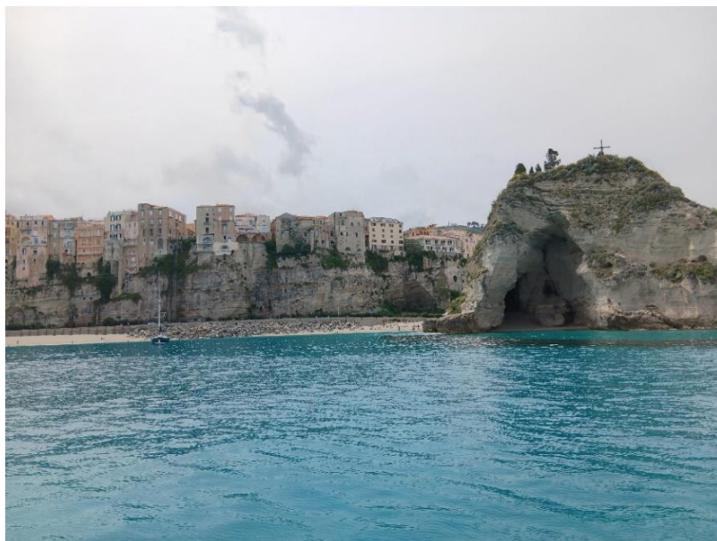
Tropea dal mare

è stata riportata alle forme originarie con i restauri dei primi del '900 e l'eliminazione delle decorazioni incongruenti. Un'ultima escursione al santuario di Santa Maria dell'Isola, collocato su uno scoglio, raggiungibile a piedi. Sorto in epoca medievale, come monastero benedettino, venne arricchito con un portico in epoca barocca. Purtroppo i rifacimenti della facciata, a seguito del terremoto del 1908, ne hanno alterato l'architettura originaria.