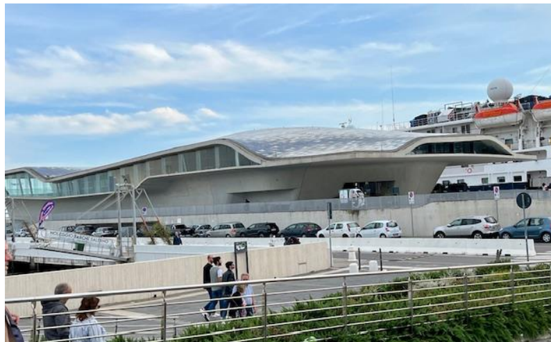
La Stazione Marittima

Prima in pullman e poi a piedi riusciamo a vedere i principali interventi realizzati negli ultimi venti anni, nell'ambito di una grande operazione di riorganizzazione e di valorizzazione della città, avviata dall'allora sindaco De Luca a partire dalla fine degli anni '90 (con l'apporto disciplinare dell'architetto spagnolo Oriol Bohigas ). L'obiettivo era di assegnare a Salerno nuovi ruoli dal punto di vista turistico, economico e amministrativo attraverso la messa in atto di alcuni progetti strategici. Sono seguiti concorsi di architettura per la realizzazione di importanti opere. Nel quadro di una razionalizzazione delle sedi dell'amministrazione della giustizia sul territorio, nasce il concorso per il nuovo Palazzo di giustizia vinto dall'architetto britannico David Chipperfield . La struttura riguarda un complesso di sei edifici, di differente altezza e colore. I lavori, avviati nel 2003 terminarono nel 2017. Si raggiunge la Stazione Marittima . A partire dalla fine degli anni '90 Salerno sentì la necessità di dotarsi di una nuova struttura che potesse accogliere il flusso dei croceristi. Nel 1999 fu indetto un concorso internazionale che fu vinto dall'architetto irachena-inglese Zaha Hadid . L'opera, di forme sinuose a somiglianza di un'ostrica, fu inaugurata nel 2016. Non lontano, vediamo la costruzione ultimata del Crescent , un complesso di residenze, attività commerciali e uffici progettato nel 2007 dall'architetto spagnolo Ricardo Bofill , in forma