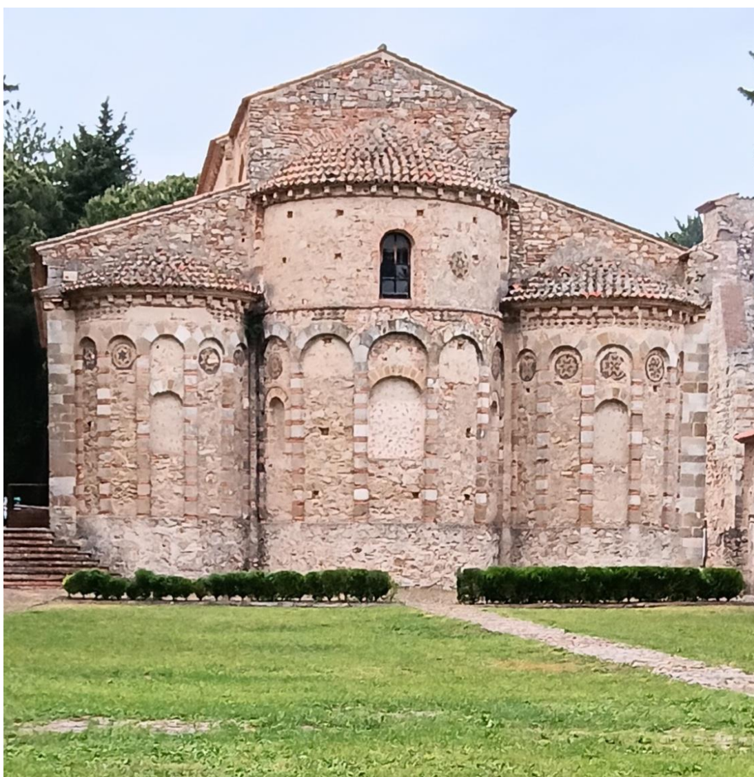
L'Abbazia di Santa Maria del Patire

ricca biblioteca, ma il reperto più prezioso è sicuramente rappresentato dallo scriptorium , la copia ad opera dei monaci amanuensi di antichi e preziosissimi testi sacri, conservati ora nella Biblioteca Vaticana. La chiesa con l'annesso Monastero fu acquistata nel 1915 dal Corpo Forestale dello Stato, divenendo bene demaniale affidato alla tutela dei Forestali, i cui uffici di servizio occupano gli antichi spazi del monastero; dal 2017, a seguito dell'accorpamento del Corpo Forestale dello Stato nell'Arma dei Carabinieri, la gestione dell'area è affidata ai militari del Reparto Carabinieri Biodiversità di Cosenza. Per la visita, infatti, ci attendeva un carabiniere. Considerata una delle più belle architetture dell'arte romanica normanna, presenta l'ingresso principale con la facciata caratterizzata da un portale al centro e due rosoni soprastanti. La chiesa, però, raggiunge la sua massima espressione artistica sulla parete opposta, con le tre absidi semicircolari che colpiscono per il gioco cromatico e volumetrico della superficie. Ogni abside è scandita da lesene, chiuse da archetti, alle cui estremità trovano posto decorazioni, in pietra lavica, a forma stellare. L'interno è a tre navate, di cui quella centrale più alta. In questa si trova un pavimento mosaicato raffigurante animali mitologici.