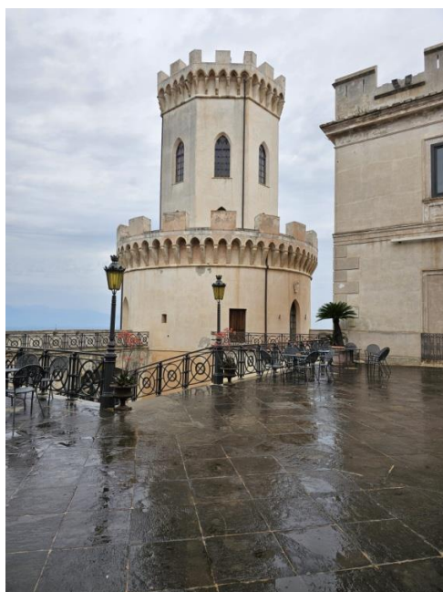
La torre del castello