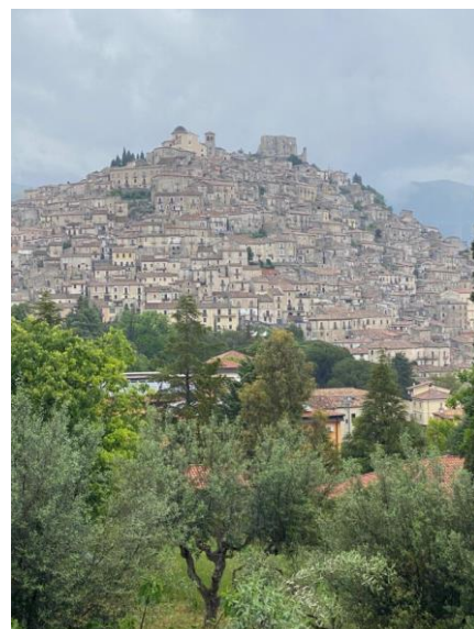
L'abitato di Morano