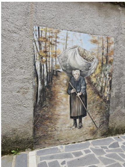
Laino. Uno dei murales