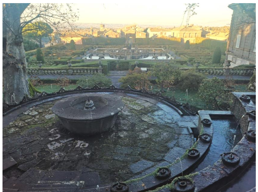
Fontana dei Lumini

Dall'alto si nota l'idea progettuale del giardino che si sviluppa lungo un solo asse centrale di simmetria che segue il pendio con un graduale passaggio dalla natura del bosco di platani e pini