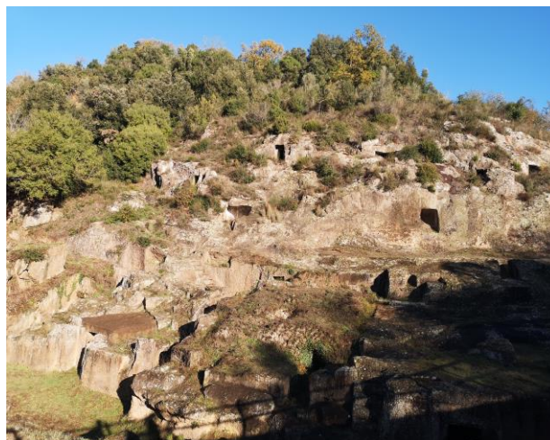
Necropoli etrusca di Pian del Vescovo

Si giunge infine al ponte della Rocca, un manufatto a schiena d'asino che scavalca il torrente Biedano, costituito da un arco centrale e due minori ai lati, costruito in blocchi di peperino messi senza calce.