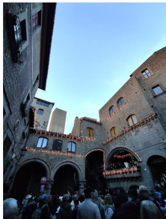
Viterbo – Piazza San Pellegrino