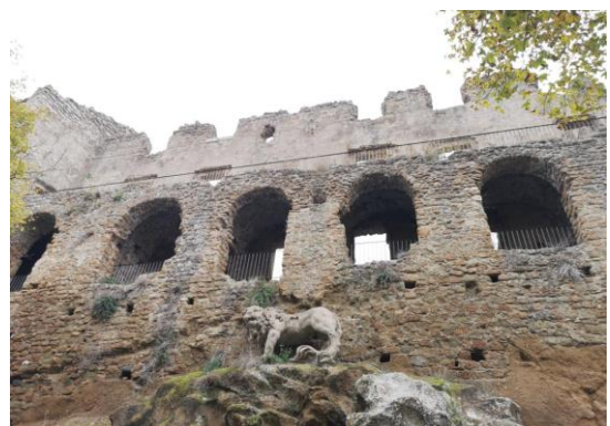
Facciata del palazzo ducale con fontana del Leone