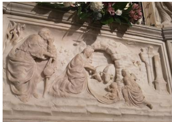
Particolare tempietto di Andrea Bregno (Michelangelo?)