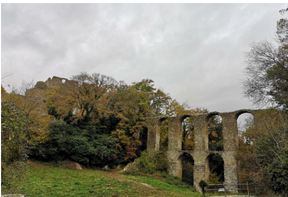
L'acquedotto dell'Antica Monterano