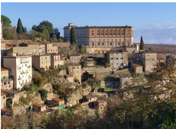
Palazzo Farnese veduta panoramica