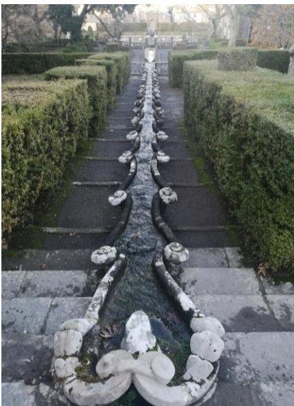
Fontana della Catena