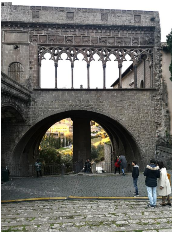
Viterbo – Palazzo dei Papi

Si attraversa poi la Piazza della Morte, dal nome accattivante, con la caratteristica fontana a fuso ornata da teste leonine, datata del secolo XIII e tutt'ora funzionante, per giungere in Piazza del Gesù dove sorge l'omonima chiesa che fu teatro nel 1271 dell'uccisione, perpetrata proprio durante la consacrazione eucaristica, di Enrico di Cornovaglia cugino del re Edoardo d'Inghilterra: evento che fa sospettare come l'assassino, tale Guido di Monfort, non fosse ferratissimo in diritto canonico. Del ghiotto fatto di cronaca nera ne fa menzione anche il padre Dante.