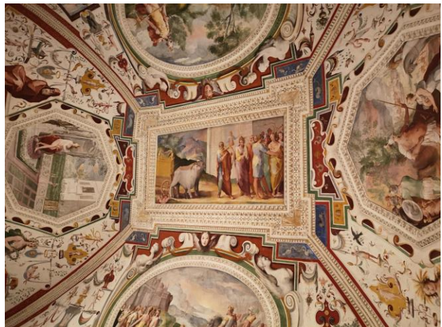
La sala di David dell'Antico Testamento