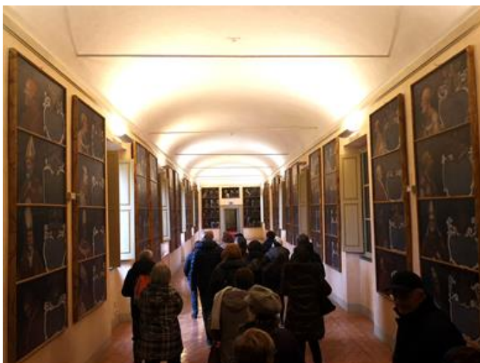
Galleria dei Papi