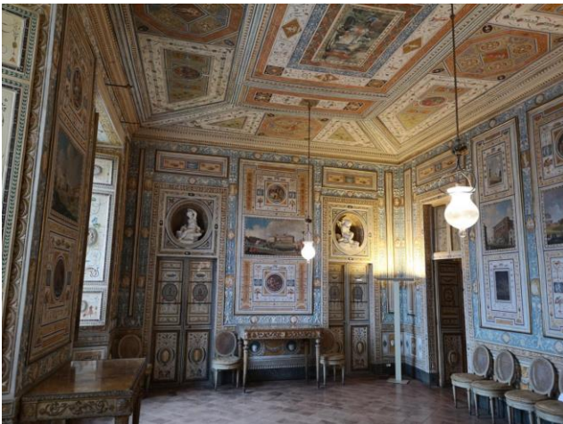
La sala da pranzo