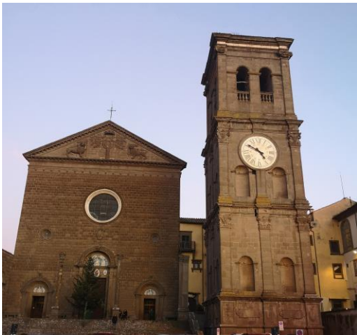
Santuario della Madonna della Quercia

Raggiungiamo infine a Blera il nostro albergo "Da Beccone", riaperto proprio per noi, ma che presenta gli odori, il freddo, l'umidità di un luogo da tempo chiuso con tutti gli inconvenienti della temporanea rimessa in funzione. Un'ottima e abbondante cena, con sequenza di pizza al rosmarino, bruschette all'olio, rigatoni con ferlenghi (una specie locale di finferli), brasato di maiale, coniglio alle olive, verdura e frutta varie, pietanze tutte annaffiate da vino bianco e nero della casa, acquieta gli animi e si va subito a dormire perché fuori incombe il deserto.