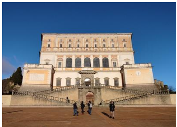
Palazzo Farnese - Facciata