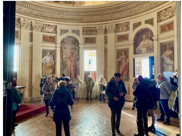
Palazzo Farnese - interno

Al posto dei bastioni d'angolo l'architetto inserì delle ampie terrazze aperte sulla campagna circostante, mentre al centro della dimora fu realizzato un cortile circolare a due piani, con il superiore leggermente arretrato. Vignola fece anche tagliare la collina con scalinate in modo da isolare il palazzo e, allo stesso tempo, integrarlo armoniosamente con il territorio circostante; inoltre fu aperta una strada rettilinea nel centro del paesino sottostante, così da collegare visivamente il palazzo alla cittadina ed esaltarne la posizione dominante su tutto l'abitato.