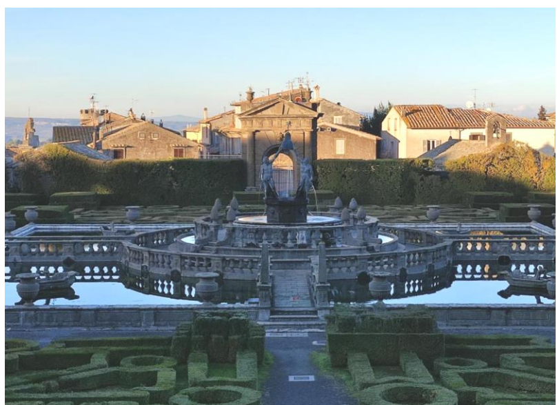
Fontana del Quadrato