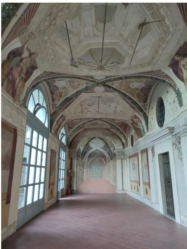
Loggia della Palazzina Montalto

La loggia della Palazzina gemella del Montalto, costruita un trentennio più tardi, mostra una pittura più classicheggiante con prospettive illusionistiche e trompe-l’oeil. Nella volta è dipinta un’aerea uccelliera con una grande varietà di esemplari anche esotici.