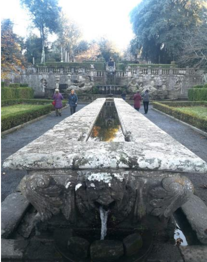
Tavola del Cardinale

della Fontana del Diluvio alla geometria perfetta del parterre con la Fontana del Quadrato ai piedi del pendio. Il parterre è suddiviso in sedici quadrati, con i dodici circostanti occupati da aiuole geometriche di bosso e tasso potati secondo la mirabile “ars topiaria”, i quattro centrali occupati dalla fontana, dove al centro su base circolare emerge il gruppo scultoreo dei Mori, attribuito al Giambologna o alla sua bottega, eseguito nel periodo di possesso del Cardinale Montalto, come si desume dagli emblemi della casata. Il Quadrato assume il ruolo conclusivo del percorso dell’acqua: