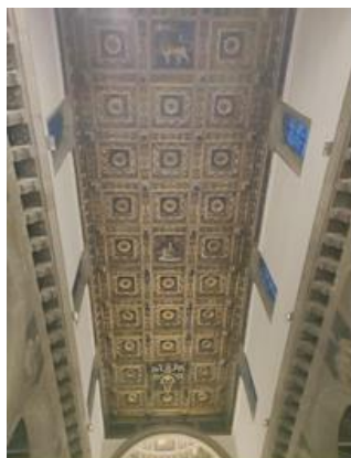
Soffitto a cassettoni dorati