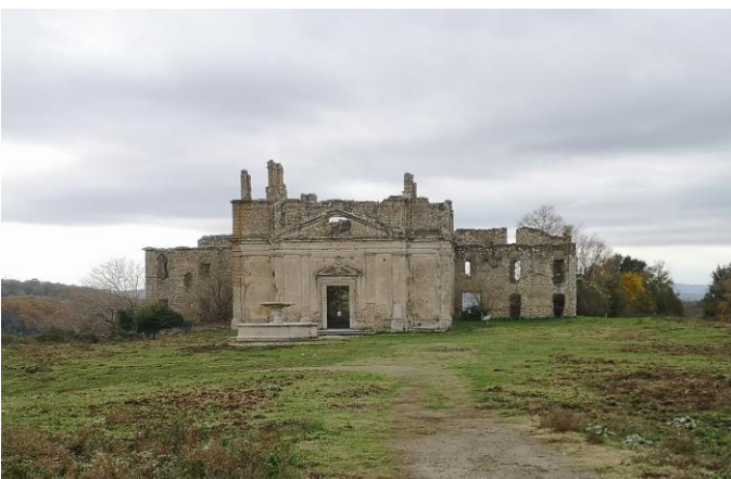
Chiesa di S. Bonaventura