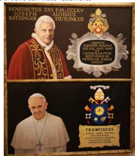
Papa Benedetto XVI e papa Francesco