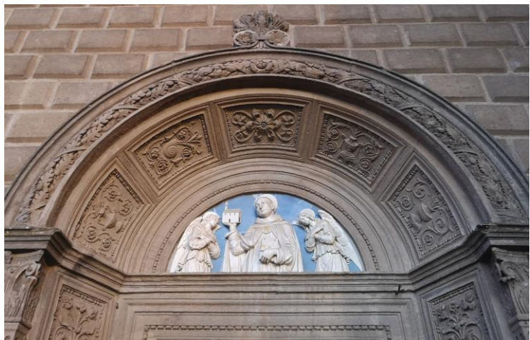
Lunetta con terracotta di Andrea Della Robbia