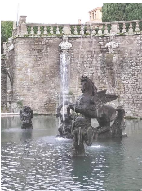
Fontana di Pegaso

Insomma luoghi di riposo e di diletto per goderecci Cardinali!