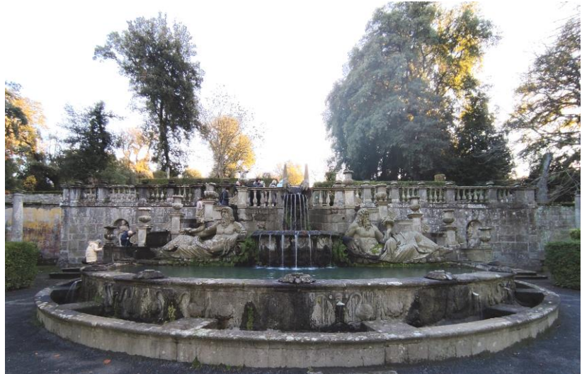
Fontana dei Giganti