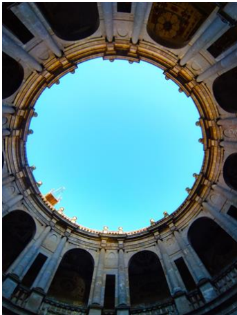
Palazzo Farnese - cortile interno

Caprarola venne inizialmente affidata dall'allora cardinale Alessandro Farnese il Vecchio ad Antonio da Sangallo il Giovane, che progettò una rocca pentagonale con bastioni angolari. I lavori iniziarono nel 1530, ma furono sospesi nel 1546 a causa della morte del Sangallo. Il cardinale Alessandro il Giovane, insediatosi a sua volta a Caprarola, volle riprendere il progetto del nonno, così, nel 1547, affidò il cantiere al Vignola, ma i lavori ripresero solo nel 1559. Vignola, venuto meno lo scopo difensivo, modificò radicalmente il progetto originario: la costruzione, pur mantenendo la pianta pentagonale della primitiva fortificazione, venne trasformata in un imponente palazzo rinascimentale, che divenne poi la residenza estiva del cardinale e della sua corte.