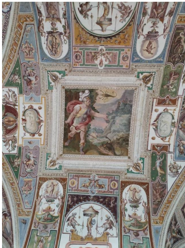
Volta della loggia della palazzina Gambara

Con una breve passeggiata ci inoltriamo nel parco, tra lecci plurisecolari che scandiscono i viali, fino al Casino di Caccia, un modesto edificio seppur il più antico del complesso. Raggiungiamo poi la neviera, una costruzione costituita dal profondo pozzo del ghiaccio, dove veniva stipata la neve, e da un vano cilindrico fuori terra coperto da una calotta. La struttura forniva ghiaccio nella stagione calda, in particolare le cronache descrivono che il Cardinale Montalto andava ghiotto per i gelati e proprio ad una congestione, sembra, dovette la sua improvvisa scomparsa.