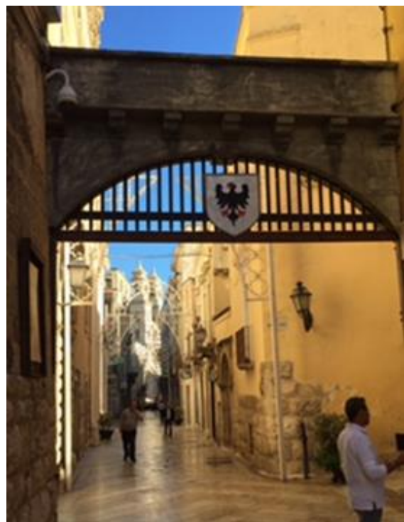
Una Porta della città

Mentre la passeggiata si snoda attraverso il centro storico, la retroguardia, dopo aver inutilmente cercato un panificio aperto, si accontenta di rifornirsi di appetitose e fresche mozzarelle di bufala recuperate in una invitante latteria.