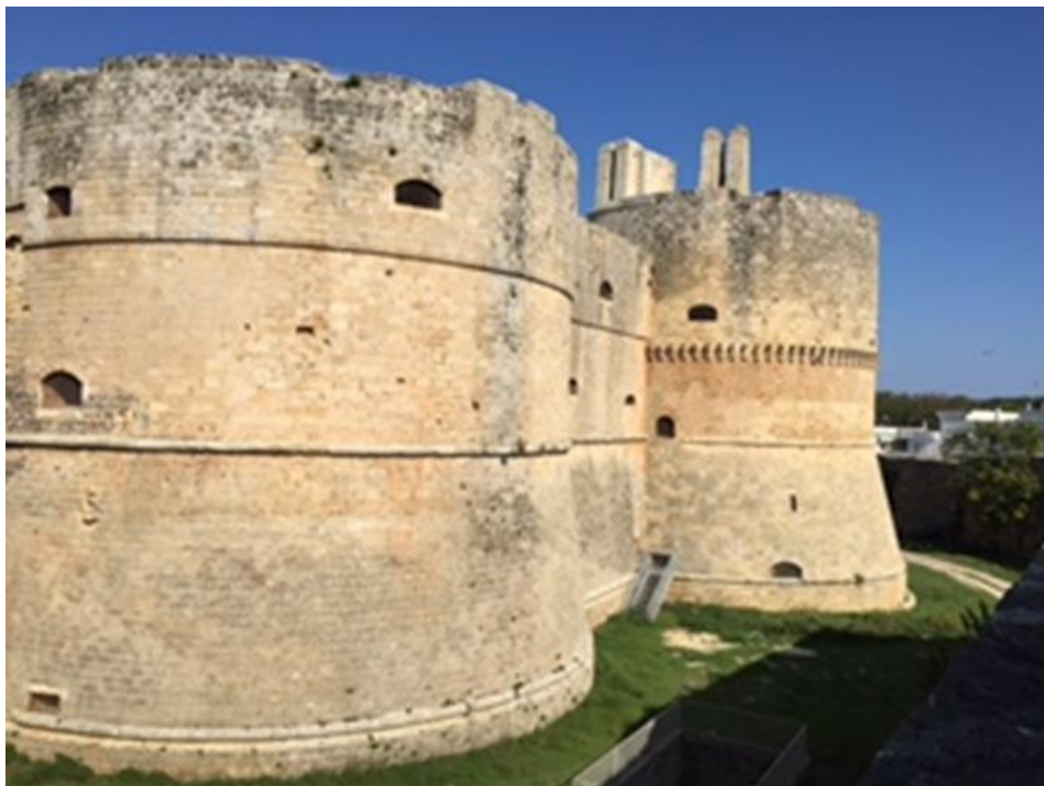
Otranto il Castello Aragonese

Segue una passeggiata sui bastioni, con visione dell'imponente Castello Aragonese, e nel borgo antico, riconosciuto patrimonio culturale dell'Unesco.