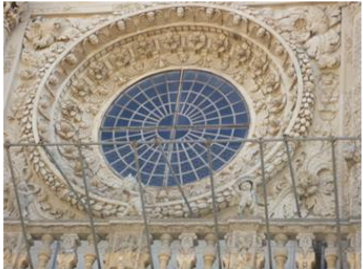
Lecce il Duomo di Santa Maria Assunta

Alle 12,30 si riparte per Otranto, il comune più orientale d'Italia che dà il nome all'omonimo Canale, braccio di mare che separa l'Italia dall'Albania, che viene raggiunta dopo un'ora di viaggio. Lasciato il pullman e arrivati sul lungomare, una breve pausa pranzo consente ai più di riprendere forze e agli irriducibili di tuffarsi in mare, accompagnati tuttavia da un grosso senso di invidia dei rinunciatari.