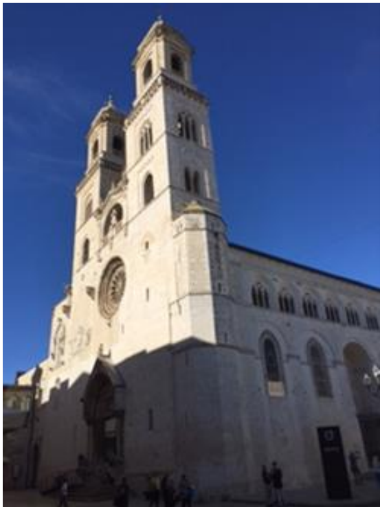
La Cattedrale di santa Maria Assunta

Visitata la Cattedrale di Santa Maria Assunta, bell'esempio di stile romanico pugliese fondata da Federico II di Svevia nel 1232, segue una doverosa sosta al celebre caffè Lonchi, dove, a bilanciare tanto apporto di arte, corre l'obbligo di assaggiare i celebri "Sospiri" di Altamura, nelle versioni con e senza glassa.