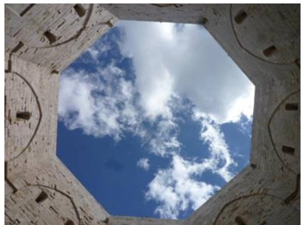
Castel del Monte

Terminata la visita si riparte alla volta di Trani, che viene raggiunta verso le ore 13. La città, conosciuta come "la perla dell'Adriatico" è nota anche per la produzione di un particolare tipo di marmo, detto appunto "pietra di Trani".