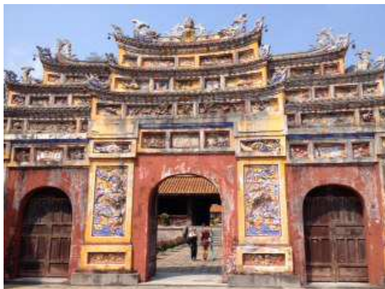
Hue – La Cittadella

Proseguiamo con una breve crociera sul fiume dei Profumi in sampan, imbarcazione tipica con immancabili dragoni a prua e vendita di oggetti d'abbigliamento, imprescindibile e graditissima dalle signore. Facciamo una sosta alla Pagoda della Signora Celeste Thien Mu, un santuario buddista risalente al XVII secolo.