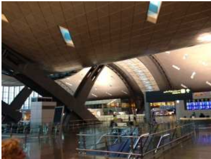
Doha il nuovo aeroporto

Dopo circa 4 ore di sonno in un albergo poco lontano dall'aeroporto, vi ritorniamo osservando quanto diverso è il mondo in cui ci ritroviamo ora: pura opulenza, modernità e ricchezza.