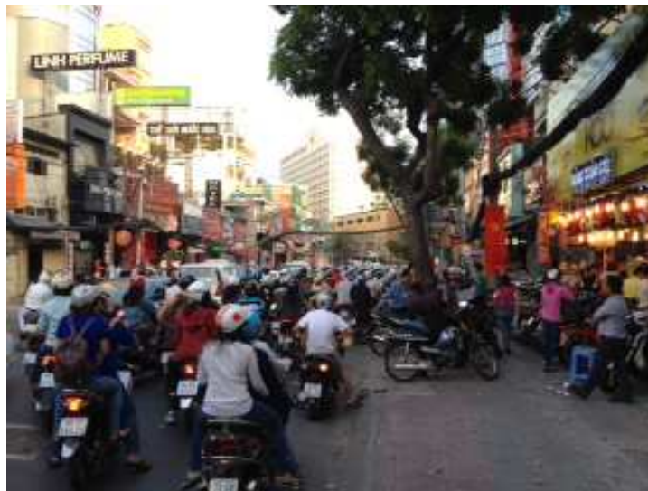
Una strada di Ho Chi Minh City

La prima cena, tipicamente vietnamita, è davvero deliziosa: involtini primavera che ci insegnano ad avvolgere con pasta di riso, involtini fritti, verdure crude o cotte a vapore, insaporite con spezie dal gusto agrodolce. Sono sapori che ci accompagneranno per tutto il resto del viaggio, che non tutti apprezzeranno e che personalmente ho invece trovato appetitosi e digeribili.