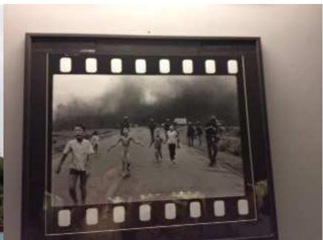
Ho Chi Minh City - Museo dei residui bellici