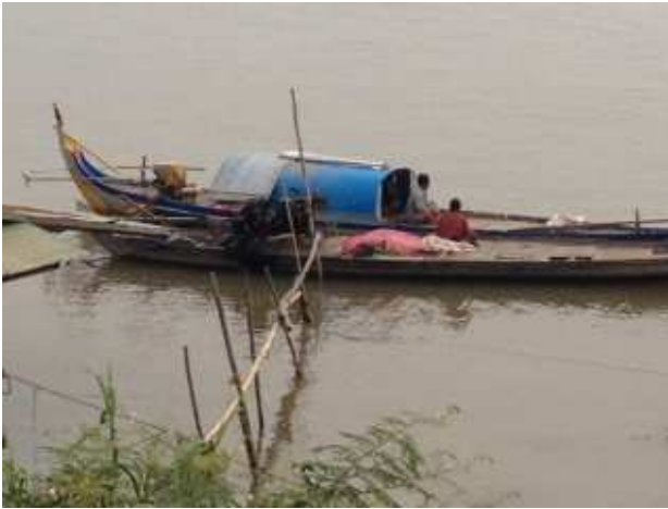
Imbarcazione tipica sul fiume Rosso