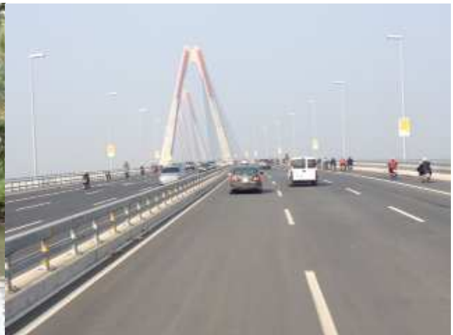
Hanoi - Ponte Cau Thanh Tri sul Fiume Rosso

In serata non ci facciamo mancare un breve giro lungo le strade della città, a bordo dei tradizionali risciò a pedali.