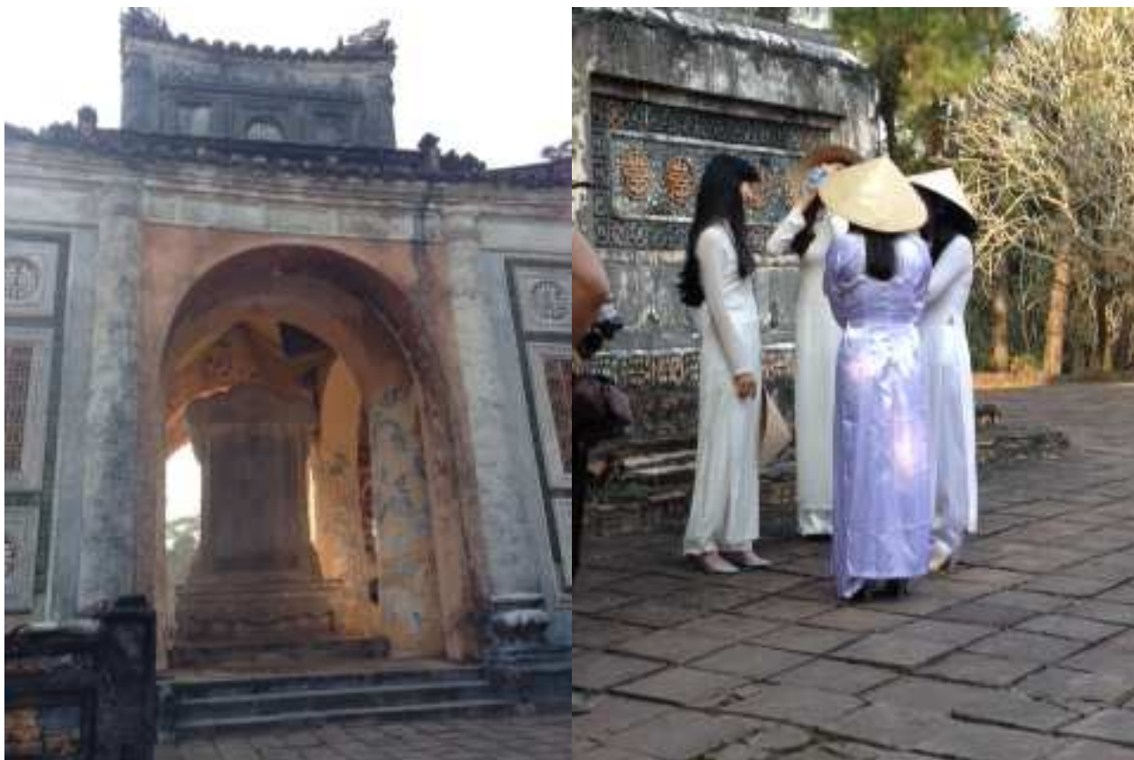
Tomba di Tu Duc

Segue la visita alla tomba di Khai Dinh dove vediamo una bella ara sacrificale e il ritratto del re.