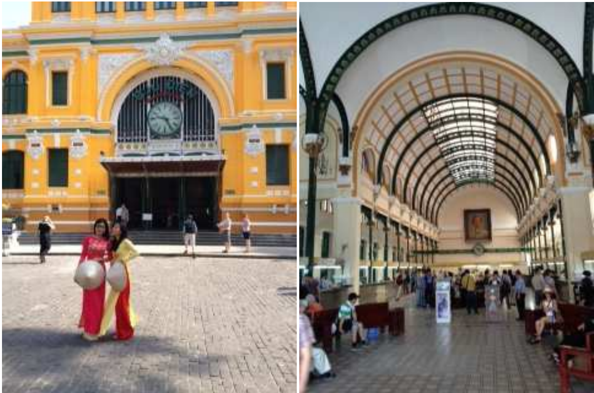
Ho Chi Minh City - Poste Centrali