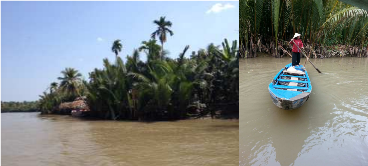
Delta del Mekong